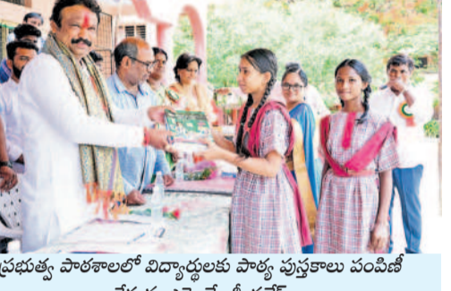
ప్రభుత్వ పాఠశాలలో విద్యార్థులకు పాఠ్య పుస్తకాలు పంపిణీ చేస్తున్న ఎమ్మెల్యే శ్రీ గణేశ్