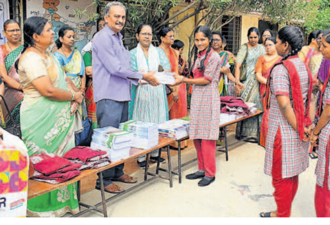
మేనవి నిలవులు ముగించుకొని బుధవారం పాఠశాలలు ప్రారంభమయ్యాయి. దానిలో భాగంగా పోలీస్ స్టేట్ ప్రభుత్వ పాఠశాలలో విద్యార్థులకు నోట్ బుక్స్, పుస్తకాలను ఉపాధ్యాయులు పంపిణీ చేశారు.