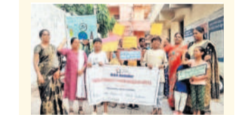
బాలకార్మిక వ్యతిరేక ర్యాలీ నిర్వహిస్తున్న రియన్ బో టెర్నింగ్ సెంటర్ సభ్యులు