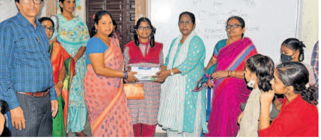
సికింద్రాబాద్లోని రెజ్జంట్లలోని నందంపేట స్కూల్లో విద్యార్థులకు నోట్ బుక్స్ ను పంపిణీ చేస్తున్న ఉపాధ్యాయులు