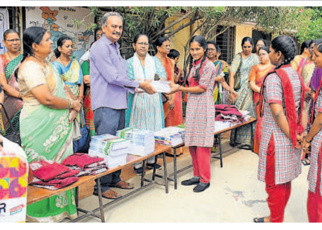
మేనవి నిలవులు ముగించుకొని బుధవారం పాఠశాలలు ప్రారంభమయ్యాయి. దానిలో భాగంగా పోలీస్ స్టేట్ ప్రభుత్వ పాఠశాలలో విద్యార్థులకు నోట్ బుక్స్, పుస్తకాలను ఉపాధ్యాయులు పంపిణీ చేశారు.