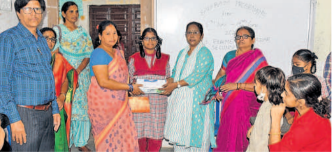
సికింద్రాబాద్లోని రెజ్జంట్లలోని నందంపేట స్కూల్లో విద్యార్థులకు నోట్ బుక్స్ ను పంపిణీ చేస్తున్న ఉపాధ్యాయులు