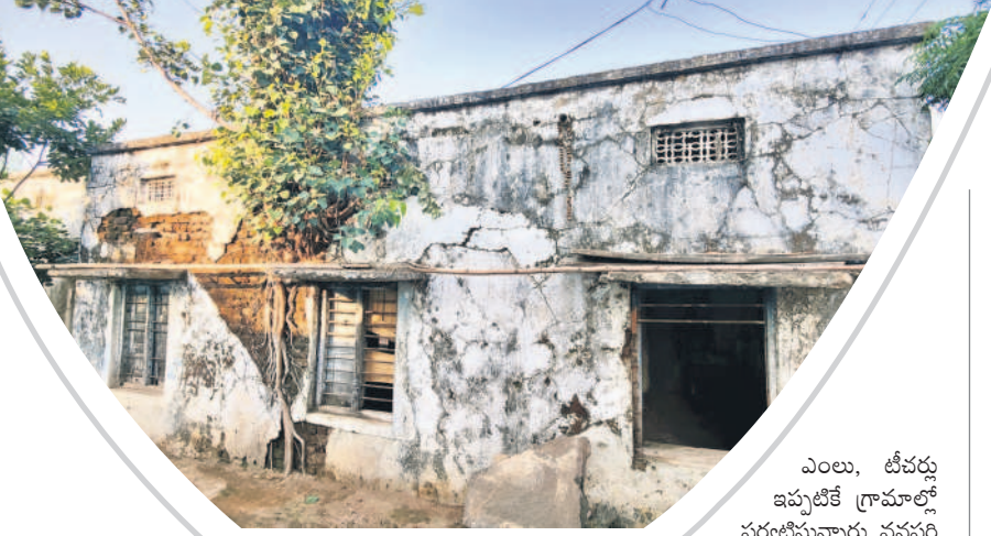
శిథిలావస్థలో ఉన్న పాఠశాల భవనం గోడలో పెరిగిన చెట్టు

మారడంతో పనులు జరగలేదు. ప్రస్తుతం అమ్మ ఆదర్శ పాఠశాలకు ఎంపికైంది. అయితే ప్రస్తుతం వర్షాలం ప్రారంభం కావడంతో ముంపు పొంది ఉన్నది. నేటి నుంచి పాఠశాలలు పునఃప్రారంభంకానున్న సందర్భంలో ఎప్పుడు ఏ ప్రమాదం జరుగుతుందోనని విద్యార్థులు, వారి తల్లిదండ్రులు భయాందోళన వ్యక్తం చేస్తున్నారు.