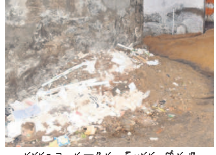
వనపర్తి తెలుగువాడీ స్కూల్ ఆవరణలో మట్టి

పడేస్తున్నట్లు, బదిలీలపై దృష్టి సారించడంలో పాఠశాలలకు ఆరంభంలోనే అలంకాలు కలగనున్నాయి. ప్రభుత్వం చేపట్టిన బడిబాట ఈ నెల 8 నుంచి ప్రారంభమై 19వ తేదీ వరకు జరగాల్సి ఉండగా.. ఈ కార్యక్రమం మొత్తంబడిగా సాగుతున్నది. ఉపాధ్యాయులతో తమకు ఏ స్థానాల్లో పోస్టింగ్ వస్తుందోన్న ఆందోళనలో ఉంటున్నారు. ఇక పూర్తిస్థాయిలో పుస్తకాలు, నోటుబుక్కులు మండలాలకు చేరలేదు. ఈ విద్యాసంవత్సరం పాఠశాలల బడి వేళలు మారగా.. ఉదయం 9 గంటలకే ప్రారంభం కానున్నాయి. గ్రామాల నుంచి పూర్తి స్థాయిలో బస్సు రవాణా లేకపోవడం ఇబ్బందిగా మారే అవకాశం ఉన్నది. ఇక ప్రతి