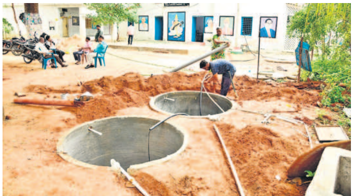
మహబూబ్ నగర్ గాంధీనగర్ రోడ్డు హైస్కూల్లో పనులు చేపడుతున్న కూలీలు

నాలుగో శనివారం నోట్ బుక్ గేట్ అమలు కానున్నది. అలాగే ప్రతిరోజూ అరగంట పాటు పాఠ్యపుస్తకాల పఠనం, కథల పుస్తకాలు, దినపత్రికలు, మ్యాగజైన్లు వదిలివేసేందుకు నిర్ణయించింది. పదో తరగతి విద్యార్థులకు 2025 జనవరి 10వ తేదీ నాటికి సెలబ్స్ పూర్తి చేసి రివిజన్ తరగతులు నిర్వహించనున్నారు. ఫిబ్రవరి 28 వరకు 9వ తరగతి విద్యార్థుల సెలబ్స్ పూర్తి చేసి రివిజన్ చేయనున్నారు. అలాగే పాఠశాలల్లో యోగా, మెడిటేషన్ తరగతులు నిర్వహించాలని సర్కారు నిర్ణయించింది. కాగా పాఠశాలల్లో సమస్యలు ఎప్పుడీలాగే ఉన్నాయి. టీఆర్ఎస్ హయాంలో చేపట్టిన 'మనఊరు-మనబడి' పనుల నిర్వహణ అటకెక్కింది. దీని స్థానంలో తీసుకొచ్చిన 'అమ్మ ఆదర్శ' పాఠశాల పథకం పేరుకు మాత్రమే అమలువుతున్నది. మన ఊరు-మనబడి పథకంలో భాగంగా ఎంపిక చేసిన స్కూళ్లలో రూ. లక్షలు వెచ్చించి అభివృద్ధి చేయాలి. అమ్మ ఆదర్శ పాఠశాలల కింద రూ. 25వేలతో పనులు చేపట్టడం స్కూళ్ల నిర్వహణపై ప్రభుత్వ చిత్తశుద్ధి తెలియజేస్తున్నది. చాలా స్కూళ్లలో మూత్రశాలలు, మరుగుదొడ్లు సక్రమంగా లేవు. పలు పాఠశాలలు శిథిలావస్థకు చేరి వెచ్చబాడే దశలో ఉన్నాయి. మొత్తం మీద ఈ విద్యా సంవత్సరం విద్యార్థులకు పలు సమస్యలతో స్వాగతం పలుకుతున్నది.