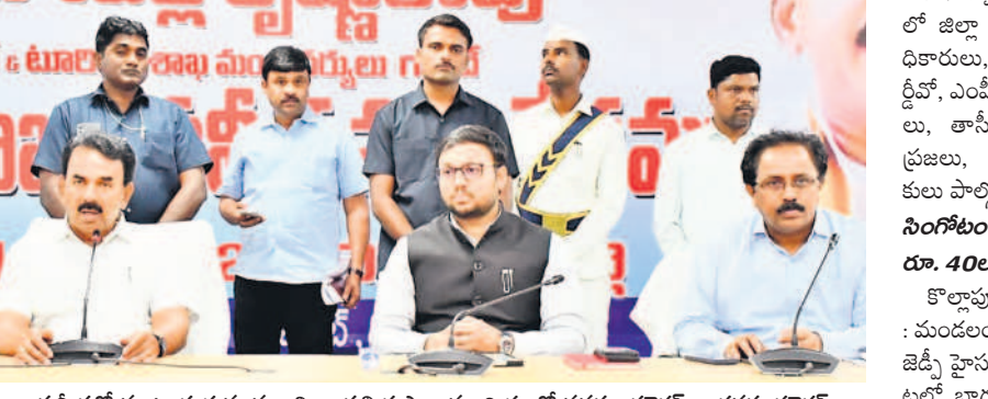
సమీక్షలో మాట్లాడుతున్న మంత్రి జూపల్లి కృష్ణారావు, చిత్రంలో వనపర్తి కలెక్టర్, అదనపు కలెక్టర్