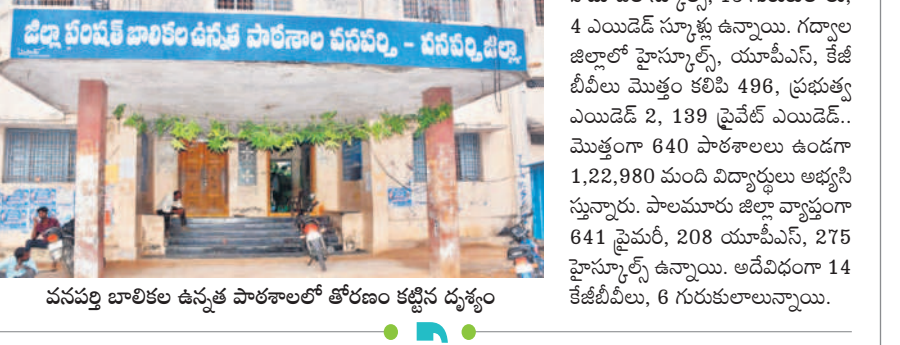
వనపర్తి బాలికల ఉన్నత పాఠశాలలో తోరణం కట్టిన దృశ్యం

వనపర్తి టౌన్/నారాయణపేట రూరల్/గద్వాలటౌన్/పాలమూరు, జూన్ 11 : నేటి నుంచి బడిగంట మోగనున్నది. ఈ నెల 6 నుంచి బడిబాట ప్రారంభమవుతూ.. హెన్