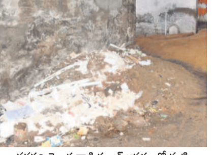
వసపల్లి తెలుగువాడీ స్కూల్ ఆవరణలో మట్టి

నాలుగో శనివారం నోట్ బుక్ల డే అమలు కానున్నది. అలాగే ప్రతిరోజూ అరగంట పాటు పాఠ్యపుస్తకాల పఠనం, కథల పుస్తకాలు, దినపత్రికలు, మ్యూజిక్ సెషన్లు చేపట్టించేందుకు నిర్ణయించింది. పడో తరగతి విద్యార్థులకు 2025 జనవరి 10వ తేదీ నాటికి సెలబ్స్ పూర్తి చేసి రివిజన్ తరగతి విద్యార్థులకు సెలబ్స్ పూర్తి చేసి రివిజన్ చేయనున్నారు. అలాగే పాఠశాలల్లో యోగా, మెడిటేషన్ తరగతులు నిర్వహించాలని సర్కారు నిర్ణయించింది. కాగా పాఠశాలల్లో సమన్వయ వ్యవస్థలను ప్రోత్సహించాలి. భీమవరం హయాంలో చేపట్టిన 'మన ఊరు-మన బడి' పనుల నిర్వహణ అటకెక్కింది. దీని స్థానంలో తీసుకొచ్చిన 'అమ్మ ఆదర్శ' పాఠశాల పథకం పేరుకు మాత్రమే అమలువుతున్నది. మన ఊరు-మన బడి పథకంలో భాగంగా ఎంపిక చేసిన స్కూళ్లలో రూ. 1 లక్షల వెచ్చింపు అతివృద్ధి చేయాలి. అమ్మ ఆదర్శ పాఠశాలల కేంద్రం రూ. 25వేలతో పనులు చేపట్టేందుకు స్కూళ్ల నిర్వహణపై ప్రభుత్వ చిత్తశుద్ధి తెలియజేస్తున్నది. చాలా స్కూళ్లలో మూత్రశాలలు, మరుగుదొడ్లు సక్రమంగా లేవు. పలు పాఠశాలలు శిథిలావస్థకు చేరి వెచ్చింపాడే దశలో ఉన్నాయి. మొత్తం మీద ఈ విద్యా సంవత్సరం విద్యార్థులకు పలు సమస్యలతో స్కాగతం పలుకుతున్నది.