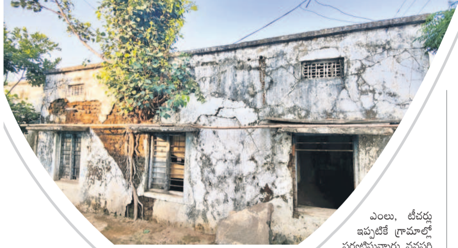
నిమ్మలూరుగడ్డలో ఉన్న పాఠశాల భవనం గోడలో పెరిగిన చెట్టు