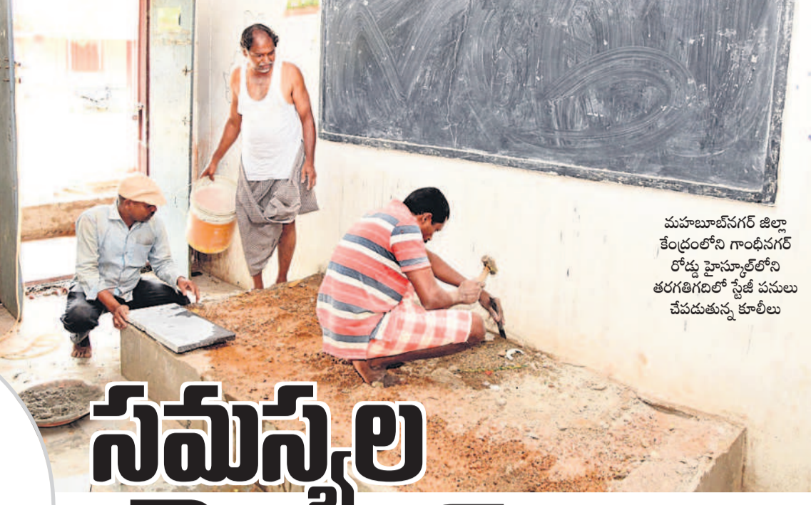
మహబూబ్ నగర్ జిల్లా కేంద్రంలోని గాంధీనగర్ రోడ్డు హైస్కూల్లోని తరగతిగదిలో స్ట్రెజ్ పనులు చేపడుతున్న కూలీలు