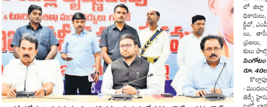
సమీక్షలో మాట్లాడుతున్న మంత్రి జూపల్లి కృష్ణారావు, చిత్రంలో వసపల్లి కలెక్టర్, అదనపు కలెక్టర్

పాఠశాలల పాలన అందించేందుకు అధికారులు పూర్తి సహకారం అందించాలన్నారు. అన్ని పాఠశాలల్లో మౌలిక వసతులు కల్పించేలా చర్యలు తీసుకోవాలని సూచించారు. సర్కారు బడుల్లోని విద్యార్థుల సంఖ్య, ప్రస్తుతం ఉన్న ఉపాధ్యాయులు, ఖాళీలపై ఆరా తీశారు. ఖాళీగా ఉన్న పోస్టులను భర్తీ చేయాలని, పెద్దదగడ, పెద్దమూర్తీలోని సర్కారు బడులను కొత్తగా రేట్ సేయడం అభివృద్ధి చేసేందుకు నిధులు మంజూరు చేస్తామన్నారు. విద్యుత్ శాఖ అధికారులు రైతులను ఇబ్బందులకు గురిచేస్తే సహాయం చేస్తామన్నారు. వ్యవసాయ విద్యుత్ కనెక్షన్ కోసం ఎంత