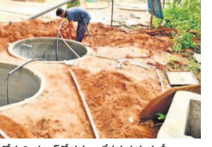
మహబూబ్ నగర్ గాంధీనగర్ రోడ్డు హైస్కూల్లో పనులు చేపడుతున్న కూలీలు