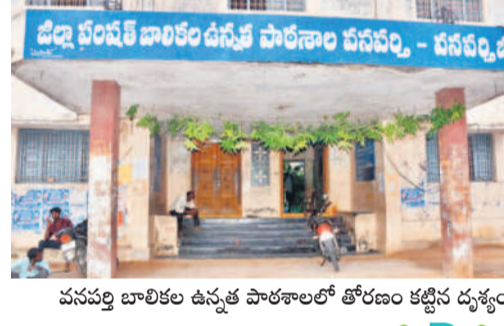
వనపర్తి బాలికల ఉన్నత పాఠశాలలో తోరణం కట్టిన దృశ్యం

జడ్పీ టౌన్/నారాయణపేట రూరల్/గద్వాలటౌన్/పాలమూరు, జూన్ 11 : నేటి నుంచి బడిగంట మోగనున్నది. ఈనెల 6 నుంచి బడిబాట ప్రారంభమవుతుంది. హెన్