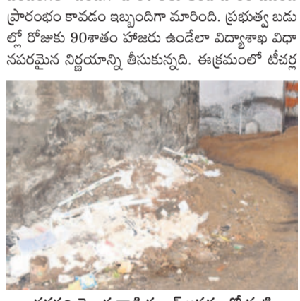
వనపర్తి తెలుగువాడి స్కూల్ ఆవరణలో మట్టి

పడేస్తుంటుంది, బదిలీలపై దృష్టి సారించడంలో పాఠశాలలకు ఆరంభంలోనే అలవాటు కలగనున్నాయి. ప్రభుత్వం చేస్తున్న బడిబాట ఈనెల 6 నుంచి ప్రారంభమై 19వ తేదీ వరకు జరగాల్సి ఉండగా.. ఈ కార్యక్రమం మొత్తం బడిగా సాగుతున్నది. ఉపాధ్యాయులంతా తమకు ఏ స్థానాల్లో పోస్టింగ్ వస్తుందోన్న ఆందోళనలో ఉంటున్నారు. ఇక పూర్తిస్థాయిలో పుస్తకాలు, నోటుబుక్కులు మండలాలకు చేరలేదు. ఈ విధానంపట్ల పాఠశాలల బడి వేళలు మారగా.. ఉదయం 9 గంటలకే ప్రారంభం కానున్నాయి. గ్రామాల నుంచి పూర్తి స్థాయిలో బస్సు రవాణా లేకపోవడం ఇబ్బందిగా మారే అవకాశం ఉన్నది. ఇక ప్రతి