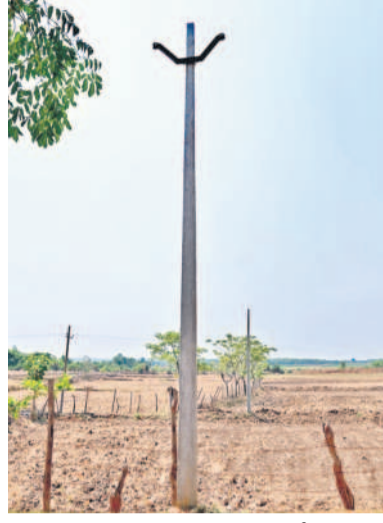
విద్యుత్ స్తంభాలు ఏర్పాటు చేసి వైర్ కనెక్షన్ ఇవ్వడంపై పనిచేసిన దృశ్యం