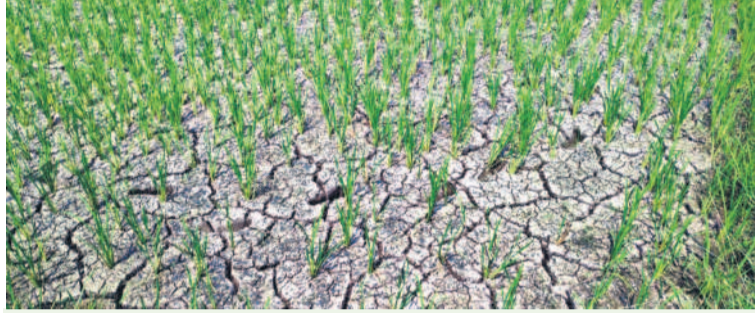
కరెంట్ కనెక్షన్ అలభ్యం కావడంతో గొల్లపల్లిలో ఎండిన వరిపాలం (ఫైల్)

పని ఎండిపోయింది. కరెంట్ లేక పాలాలు ఎందుకు చేయని ఓ రైతు విద్యుత్తు శాఖ సీఎం డికి ఫిర్యాదు చేశాడు. పాలం పోటీలను వాట్సాప్లో పంపి సమస్య వివరించాడు. దీనిపై సీఎం డికి ఫిర్యాదు నుంచి ఏకాని వివరణ కోరితే ఆడి గ్రామంలో సీక్రెట్ వేరే పాలం పోటీలు తీసి పంపి సీఎం డికి తప్పని పట్టు కలిపాడు. ఆ పోటీలు రైతుకు పంపి సీక్రెట్ వేయకుండా? అని అడిగితే 'మీరు రండి సార్.. సీక్రెట్ కున్నామంటే చూపించండి' అంటూ ఆ రైతు పట్టుకున్నాడు. ఉన్నతాధికారులు వచ్చి ఏకాని తీసుకొని ఎండిన పాలం దగ్గరికి వచ్చి 'ఇదేనా మీరు సీక్రెట్ వేయని చెప్పి పంపిన పోటీ' అని నిలదీయడంతో ఉలుకు పలుకా లేకుండా మిస్టర్ డికిపోయాడు. ఇక ఏకాపై పట్టు తీసుకుంటారేమో అని రైతులు భావించినా ఉన్నతాధికారులు ఆయననే కొనసాగించారు. చేసిన దేవుల రైతులు ఏకాకి 10 వేల ఫిన్ పో డ్యూరు సమర్పించుకున్నారు. అయినా పని పూర్తికాలేదు.