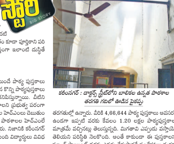
కరీంనగర్ : దాక్టర్స్ స్ట్రీట్ లోని బాలికల ఉన్నత పాఠశాల తరగతి గదిలో ఊడిన పైకప్పు

కరీంనగర్, జూన్ 11 (నమస్తే తెలంగాణ)/కమాన్ వెరస్టా : అనేక ప్రభుత్వ పాఠశాలల్లో అసౌకర్యాల రాజ్యమేలుతున్నాయి. ఎక్కడ చూసినా సమస్యలు స్వాగతం పలుకుతున్నాయి. గత ప్రభుత్వం చేపట్టిన 'మన ఊరు-మన బడి' 'మన బస్టి-మన బడి' కార్యక్రమానికి ప్రత్యామ్నాయంగా ప్రస్తుత ప్రభుత్వం 'అమ్మ ఆదర్శం పాఠశాల' పేరిట మౌలిక సదుపాయాలు కల్పిస్తామని చెప్పినా.. ఆకరణలో మాత్రం ప్రగతి అంతంతో ఉన్నది. ప్రభుత్వం ఎంత వేగిర పర్చినా పనుల్లో 50 శాతం కూడా పూర్తి కాలేకపోయాయి. కరీంనగర్ జిల్లాలో మొత్తం 698 ప్రభుత్వ పాఠశాలలు ఉండగా 'మన ఊరు -మన బడి' 'మన బస్టి -మన బడి' కింద గత ప్రభుత్వం 230 పాఠశాలలను ఎంపిక చేసింది. అందులో 40 పాఠశాలలను పైలెట్ గా ఎంపిక చేసి వాటిలో పనులు పూర్తి చేసింది. మిగతా పాఠశాలల్లో మిగిలిన పనుల గురించి ప్రస్తుత ప్రభుత్వం పట్టించుకోవడం లేదు. 'అమ్మ ఆదర్శం పాఠశాల' పేరిట ఇదే క్యాన్సెల్ చేస్తే కొత్త పథకాన్ని తీసుకున్న ప్రభుత్వం ప్రభుత్వం 345 పాఠశాలలను ఎంపిక చేసింది. వీటిలో మౌలిక సదుపాయాలు ఉండేవేమీ 14.19 కోట్ల విధ్వంసం. ఈ నిధుల నుంచి మొదల 50 శాతం విడుదల చేసింది. కాంట్రాక్టర్లను బిల్లులు