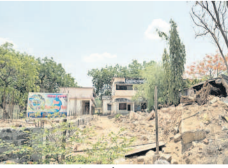
జగిత్యాల జిల్లా కేంద్రంలోని ప్రభుత్వ గర్లెన్ హైస్కూల్ కు వెళ్లే దారి దుస్థితి