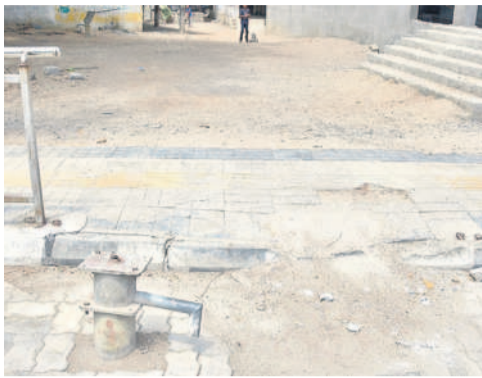
కరీంనగర్ : అశోక్ నగర్ లోని ఉర్దూ మీడియం పాఠశాలకు వెళ్లే దారిలో ప్రమాదకరంగా భోరు