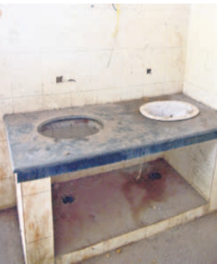
కరీంనగర్ : కార్వాన్ గడ్డ ప్రభుత్వ పాఠశాలలో అధ్యాపకాంగం సింకు

అనేక సర్కారు పాఠశాలల్లో అసౌకర్యాల అధ్యాపకాంగం గదులు.. వంటశాలలు నిర్వహణ కరువై మూలసపడ్డ మూత్రశాలలు పూర్తికాని 'అమ్మ ఆదర్శం' పనులు మారుమూల ప్రాంతాల్లో 50 శాతం ఉపాధ్యాయ భాళిలు పదోన్నతులు కల్పిస్తే తప్ప భర్తీకాని పోస్టులు పాఠశాలలకు అందని పాఠశాలకాల్లా నేటి నుంచి పాఠశాల పున: ప్రారంభం అందోళనలో విద్యార్థులు, తల్లిదండ్రులు