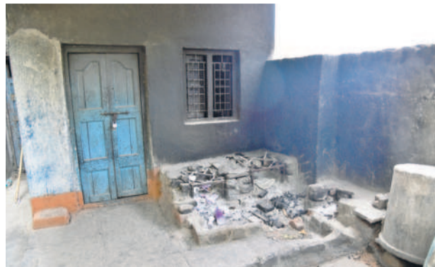
కరీంనగర్ : కార్వాన్ గడ్డ ప్రభుత్వ పాఠశాలలో అధ్యాపకాంగం వంటగది