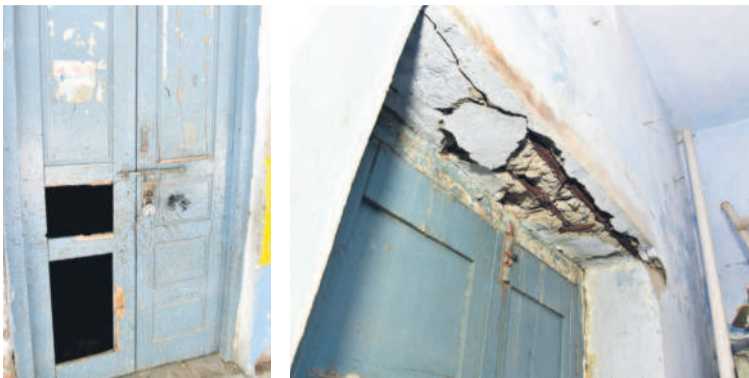
కరీంనగర్ : అశోక్ నగర్ లోని ఉర్దూ ప్రాథమిక పాఠశాలలో ఊడిపోయిన తరగతి గది తలుపు, తరగతి గది దొర వైబ్రాగంట్ ప్రమాదకరంగా పెమ్మలు