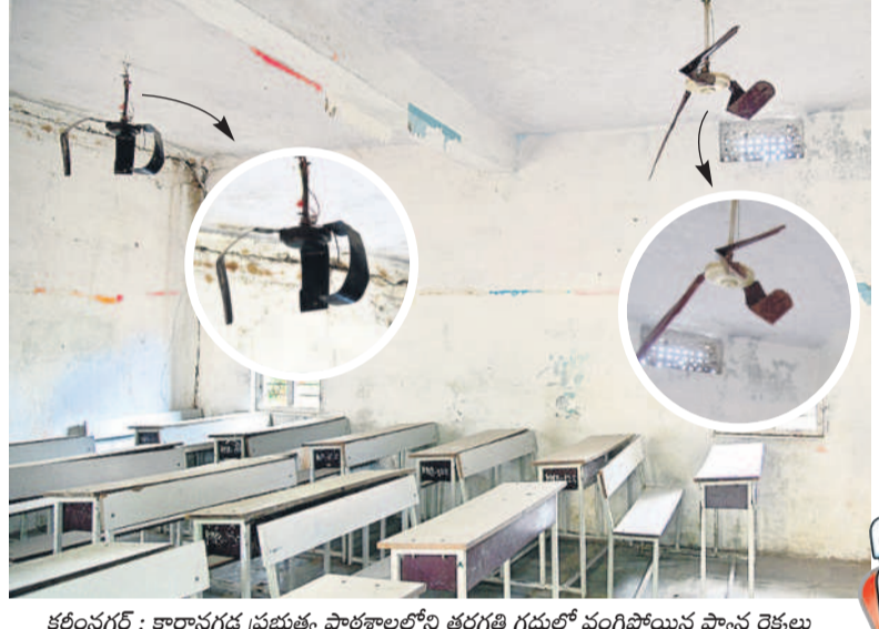
కరీంనగర్ : కార్వాన్ గడ్డ ప్రభుత్వ పాఠశాలలోని తరగతి గదుల్లో వంగిపోయిన ఫ్యాన్ రెక్కలు

పోయిన పండుగ వాతావరణంలో పున:ప్రారంభమైన సర్కారు పాఠశాలలు, ఏడాది చాలా చోట్ల సమస్యలతో స్వాగతం పలుకుతున్నాయి. వేసవి సెలవులకు టూటా చెబుతూ నేటి నుంచి స్కూళ్ల రీటెంషన్ కానుండగా, అనేక చోట్ల అసౌకర్యాల రాజ్యమేలుతున్నాయి. లేకున్నా చోట్ల పగిలి, ఉరిసేందుకు సిద్ధంగా ఉంటే, కొన్ని స్థానాలు నెర్రలుబార, పెట్టులు ఊడిపడ్తున్నాయి. ఫ్యాన్లు వంకర్లు తిరిగి అక్కడకు రాకుండా పోగా.. తరగతి గదులు, వంటశాలలు అధ్యాపకాంగం మూరాయి. మూత్రశాలలు, మరుగుదొడ్లు నిర్వహణ లేక మూలసపడి పోయాయి. ఎంత వేగిర పడినా అమ్మ ఆదర్శం పాఠశాలల్లో అధునీకరణ పనులు అనుకున్న సమయానికి పనులు పూర్తి కావడంపై అనుమానాలు వ్యక్తమవుతున్నాయి. కరీంనగర్ జిల్లాలో ₹14.19 కోట్లతో చేపట్టిన పనుల్లో ఇప్పటి వరకు 50 శాతం కూడా పూర్తి కాలేకపోయాయి. మరోవైపు ఉపాధ్యాయుల కొరత కూడా కనిపిస్తుండగా.. ఇప్పటికే పాఠశాలలకు చేరాల్సిన పాఠ్య పుస్తకాలు ఎంతో భవనాలకే పరిమితమయ్యాయి. ఇలాంటి పరిస్థితుల్లో పిల్లలను ఆయా పాఠశాలలకు పంపేందుకు తల్లిదండ్రులు ఇంకాల్సిన పనులు.