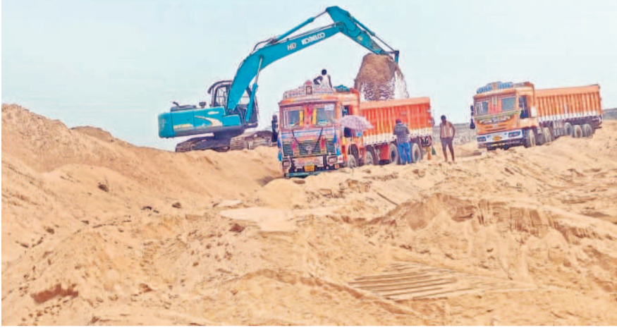
మేల వేసిన పంట భూముల్లోని ఇసుకను లాల్లిలో లోడ్ చేస్తున్న పాక్షియన్

గోదావరి పరీవాహక ప్రాంత భూములపై దళారులు, కాంట్రాక్టర్ల కన్ను రైతుల పేరుతోనే పల్లెషిస్తు.. తర్వాత కాంట్రాక్టర్లదే హవా నిబంధనలకు విరుద్ధంగా ఇసుక తవ్వకాలు ఎకరానికి రైతుకిచ్చే కౌలు రూ.లక్ష మాత్రమే అక్రమముద్రాలో కోట్లు గడిస్తున్న దళారులు