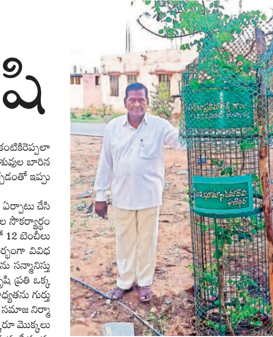
తన నాటివే మొక్క వద్ద విశ్రాంత ఉద్యోగి (ఫైల్)

వివిధ రకాల 30 మొక్కలను నాటి వాటిని కంటికిరెప్పలా కాపాడుతున్నారు. సకాలంలో నీరందిస్తూ, పశువుల బారిన పడకుండా ప్రతి మొక్కకు ట్రీగాడ్లును అమర్చడంతో ఇప్పుడవి ఏర్పాటు పెరిగాయి.