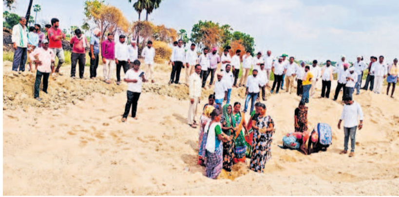
రాంబోజీగూడెం వారులో ఇసుకను పరిశీలిస్తున్న రైతులు, బీఆర్ఎస్ నాయకులు