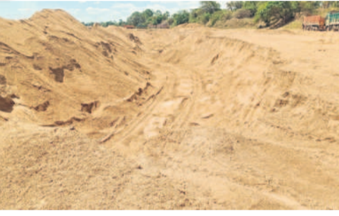
లోతుగా వేపట్టిన తవ్వకాలు

ఏటానూగారం, జూన్ 10 : పంటలు సాగు చేసే భూముల కంటే ఇసుక మేటలు వేసిన పట్టా భూములకు ప్రస్తుతం డిమాండ్ ఉన్నది. ఎకరానికి సుమారు లక్ష రూపాయల వరకు కౌలు చెల్లించేందుకు దళారులు, కాంట్రాక్టర్లు ముందుకు వస్తుండడంతో రైతులు వారి పై మొగ్గు చూపుతున్నారు. ఎకో సెన్సిటివ్ జోన్ పేరుతో మూడేళ్లగా ఇసుక మేటలు తొలగింపును అటవీశాఖ అధికారులు అడ్డుకున్నా, ఇటీవల మళ్లీ మొదలైంది. రెండు నెలల నుంచి తొలగింపు ప్రక్రియ జోరుగా సాగుతుండడంతో దళారులు, కాంట్రాక్టర్లు అలాంటి భూముల కోసం వెతుకుతున్నారు. మొదట కాంట్రాక్టర్లు, దళారులు ఇసుక మేటలు వేసిన భూములను రైతులతో ఒప్పందం కుదుర్చుకొని, ఇసుక మొత్తం తీసి వరకు అనుమతి పొందుతారు. ఇందుకు ఏడాది నుంచి మూడేళ్ల వట్టి అవకాశం ఉన్నది. గతంలో ఎకరానికి రూ.80వేల వరకు కౌలు చెల్లి చగా, ఈ ఏడాది తాజాగా రూ. లక్ష వరకు ఇస్తామంటూ రైతులతో అగ్రి మెంట్ రాయించుకుంటున్నారు. అయితే, కొంతమంది దళారులు కౌలుకు తీసుకుని డబ్బులు సరిగ్గా చెల్లించకుండా ఇబ్బంది పెడుతుండడంతో అనేక చోట్ల రైతులు ఇసుక తొలగింపును అడ్డుకున్న పుటలను కూడా ఉన్నాయి. ఏటానూగారం, తాడ్యాయి, మంగిపేట, వాజేడు, వెంకటాపురం, కన్నాయిగుడిండ్ల మండలాల్లో వేల ఎకరాల్లో ఇసుక మేటలు వేసిన భూములు ఉన్నాయి. ఇప్పట్నువారుతో పాటు అనేక వారులు, గోదావరి కోకను గుర్తిన భూములు ఇసుక మేటలతో ఉన్నాయి.