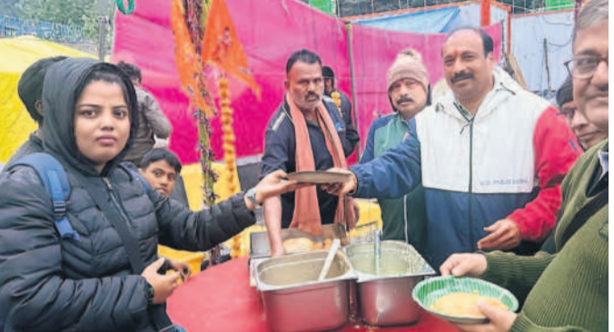
కేదార్నాథ్ ఆలయం వద్ద ఏర్పాటు చేసిన అన్నదానం శిబిరంలో భక్తులకు అన్నదానం చేస్తున్న సేవా సమితి ప్రతినిధులు

కేదార్నాథ్ భక్తుల కడుపునింపుతున్న సిద్దిపేట అన్నదాన సేవసమితి