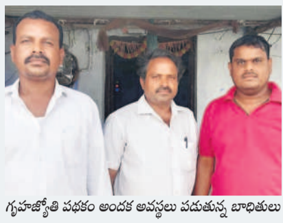
గృహజ్యోతి పథకం అందక అవసరం వదుతున్న బాధితులు

బెజ్జంకి, జూన్ 10: ప్రభుత్వ పథకాలు అర్దులకు అందని ద్రాక్షలా మారాయి. సిద్దిపేట జిల్లా బెజ్జంకి మండల కేంద్రానికి చెందిన అర్ధక గల కుటుంబాలు గృహజ్యోతి పథకం అందక అవసరం వదుతున్నాయి. ప్రభుత్వం సేకరించిన దరఖాస్తుల స్వీకరణలో గృహజ్యోతి పథకానికి దరఖాస్తు చేసుకున్నారు. ప్రభుత్వం ప్రవేశపెట్టిన గృహజ్యోతి పథకంలో భాగంగా సున్నా బిల్లు వస్తుంది అని ఆశా నిలబడతూ వస్తున్నాయి. కానీ కరెంట్ బిల్లు యధావిధిగా రావడంతో వారు మండల పరిషత్ కార్యాలయంలో సోమవారం సంప్రదించారు. మీరు గృహజ్యోతి పథకానికి దరఖాస్తు చేసుకోలేదని, ప్రభుత్వం సవరణ అవకాశం కల్పించిన