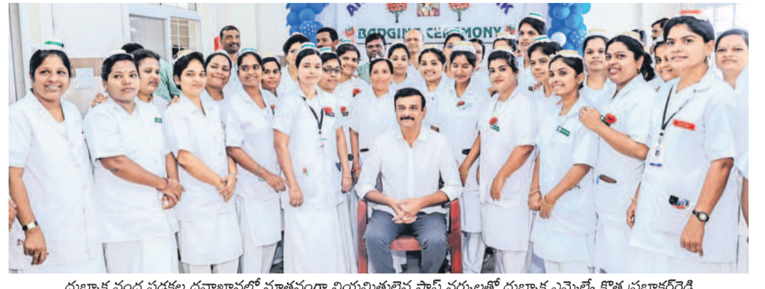
దుబ్బాక వంద పడకల దవాఖానలో సూతంగా నియమితులైన స్టాఫ్ సభ్యులతో దుబ్బాక ఎమ్మెల్యే కొత్త ప్రభాకరరెడ్డి