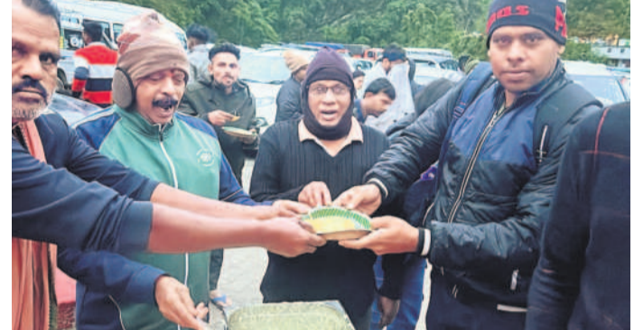
కేదార్నాథ్ ఆలయం వద్ద ఏర్పాటు చేసిన అన్నదానం శిబిరంలో భక్తులకు అన్నదానం చేస్తున్న సేవా సమితి ప్రతినిధులు

సిద్దిపేట టౌన్, జూన్ 10: అన్న పర బ్రహ్మ స్వరూపం అనే అక్షర సత్యాన్ని సిద్దిపేట కేదార్నాథ్ అన్నదాన సేవాసమితి నిజం చేసింది. అన్ని దానాల్లోకెల్లా అన్నదానం మిన్న అనే నామదీని అవరణలో చేసి భూమి తున్నది. అక్కడ ఇక్కడ కాదు.. వార్డమ్ యాత్రలో ముఖ్యమైన.. ధ్యాన జ్యోతిర్లింగం గా ప్రధానమైన కేదార్నాథ్ సన్నిధిలో అన్నదానం చేయాలని సంకల్పించి సాహసోపేతమైన పుటానికి 2019లో బీజం వేసింది. అప్పటి నుంచి హిమగిరిలోని పరమశివుడిని దర్శించుకునే భక్తులకు అన్నదానం చేస్తున్నది. ఈ పరంపరను నాలుగోసారి కొనసాగిస్తున్నది. ఈ నేపథ్యంలో యాత్రికులకు కేదార్నాథ్ అన్నదాన సేవాసమితి వారు అన్నదానం చేస్తున్న ఏర్పాటు చేశారు. ఈ ఏడాది సూతంగా కేదార్నాథ్ ఆలయనికి దగ్గరగా మరో అన్నదాన కేంద్రాన్ని భక్తుల కోరిక మేరకు ప్రారంభించారు. 100 మంది సేవా