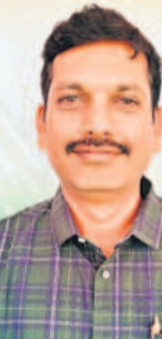
-విద్యాసాగర్, డి.ఎం.సీ, నారాయణపేట

ప్రభుత్వ పాఠశాలల్లో విద్యనభ్యసించున్న విద్యార్థుల కోసం తెలంగాణ ప్రభుత్వం పాఠ్య, నోట్ బుక్కులను ఉచితంగా అందించేందుకు ఏర్పాట్లు చేస్తున్నది. అందులో భాగంగా ఇప్పటికే జిల్లా కేంద్రానికి 3 లక్షల నోట్ బుక్కులు వచ్చాయి. వీటిని అన్ని మండలాలకు పంపిణీ చేసేందుకు చర్యలు తీసుకుంటున్నాం. అదే విధంగా విద్యార్థులకు పాఠ్యపుస్తకాలు, యూనిఫామ్స్ కూడా పాఠశాలలు తెరిచిన వెంటనే అందించేందుకు చర్యలు చేపట్టాం.