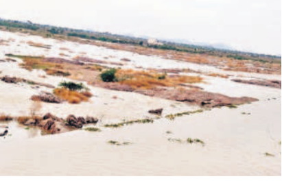
ఆర్డీఎస్ అనకట్లపై పారుతున్న వరద

మక్రల్, జూన్ 10 : ఎగువ ప్రాంతం నుంచి కృష్ణానదికి వరద వస్తుండడంతో నదిలో నీటి మట్టం క్రమక్రమంగా పెరుగుతున్నది. మూడు రోజుల నుంచి వరద నిలకడగా వస్తుండడంతో రైతులు ఆనందం వ్యక్తం చేస్తున్నారు. కృష్ణానది నుంచి దిగువన నీరు రాకుండా అడ్డుకునేందుకు కర్ణాటక రాష్ట్రం రాంపూర్ జిల్లా బీర్హాపూర్ వద్ద రోడ్ డిక్ అప్ చేసి నిర్మించారు. అయితే ఎగువ నుంచి భారీగా వరద వస్తుండడంతో సోమవారం బీర్హాపూర్ బ్యారేజ్ గేట్లు తెరవడానికి అధికారులు ప్రయత్నించినప్పటికీ గేట్లు మూయించాయి. దీంతో వరద నీరు చుట్టూరై నుంచి సిల్వోనే డ్యాం దిగువకు వస్తుండడంతో ఎప్పుడు ఏం జరుగుతుందోనని అక్కడి ప్రజలు భయాందోళనకు గురవుతున్నారు. ఎగువన భారీ వర్షాలు కురుస్తుండడంతో మరో రెండు మూడు రోజుల్లో కృష్ణమ్మకు వరద పోతే అవకాశం ఉందని నీటి పారుదల శాఖ అధికారులు తెలిపారు.