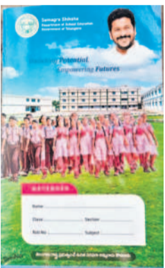
విద్యార్థులకు పంపిణీ చేయనున్న నోట్ బుక్కులు

మక్రల్ టౌన్, జూన్ 10 : ప్రభుత్వ పాఠశాలల్లో చదివే విద్యార్థులకు మొదలైన విద్యను అందించాలనే సంకల్పంతో ప్రభుత్వం అరు నుంచి పదో తరగతి విద్యార్థులకు పాఠ్యపుస్తకాలు అందించడంపై కాకుండా నోట్ బుక్కులు అందించేందుకు సిద్ధమైంది. వీటిని పంపిణీ చేసేందుకు ఇప్పటికే జిల్లా విద్యాశాఖ కార్యాలయం నుంచి అయా ఎమ్మార్వీ కార్యాలయాలకు తరలింపారు. నారాయణపేట జిల్లాలో 378 ప్రభుత్వ పాఠశాలలు ఉండగా.. అందులో 76 ఉన్నత పాఠశాలలు, 11 కస్తూర్బాగండ్ విద్యాలయాలు, రెండు మోడల్ స్కూళ్లు కలిపి మొత్తం 38 వేల మంది విద్యార్థులు ఉన్నారు. వీరి కోసం ప్రభుత్వం