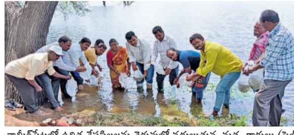
కామీరేట్లలో ఉపాధి చేపపిల్లలను చెరువల్లో వదులుతున్న మత్స్యకారులు (ఫైల్)

జనగామ రూరల్, జూన్ 10: మత్స్యకారులకు ఉపాధి చేప పిల్లల పంపిణీ లేనట్టేనా! ఈ కార్యక్రమాన్ని కాంగ్రెస్ ప్రభుత్వం ఎత్తివేసింది! అంటే పరిస్థితులు అప్పుడు అన్నట్లుగా కనిపిస్తున్నాయి. వానకాలం సీజన్ ప్రారంభమవుతున్నా ఉపాధి చేప పిల్లల పంపిణీ కోసం అవసరమైన చర్యలు చేపట్టాలి. దీంతో మత్స్యకారులు సందేహాల వ్యక్తం చేస్తున్నారు. కేసీఆర్ ప్రభుత్వం కుల వ్యవస్థకు ఎంతో ప్రాధాన్యమివ్వగా, మత్స్యకారులకు అర్థిక చేయూత కోసం వంద శాతం సబ్సిడీ చేప పిల్లలను పంపిణీ చేసింది. దీంతో గతంలో ఎప్పుడూ లేనివిధంగా మత్స్యకారులకు కుటుంబాల్లో వెలుగులు నిండాయి. కేసీఆర్ ప్రభుత్వం 2018లో ఈ కార్యక్రమం ప్రారంభించగా గత ఏడాది వరకు నిర్దిష్టంగా సాగింది. ఎనిమిది విడతలుగా చేప పిల్లలను ఉపాధి పంపిణీ చేశారు. జిల్లాలో సుమారు 782 చెరువులు, రిజర్వాయర్లు, కుటుంబ ఉన్నాయి. గత ఏడాది ప్రభుత్వం 2.72కోట్ల చేపపిల్లలను పంపిణీ చేయడానికి అనుమతిని ఇచ్చింది. జిల్లాలో 170 మత్స్యకార సంఘాలు ఉన్నాయి. అందులో సుమారు 17వేల మంది సభ్యులుగా ఉన్నారు. 35 ఏంపిం నుంచి 100 ఏంపిం వరకు ఉన్న చేప పిల్లలను రిజర్వాయర్లు, చెరువుల్లో వదిలేశారు. ఉపాధి చేప పిల్లల పంపిణీ ద్వారా మత్స్యకారులందరికీ భారీగా పెరిగి మత్స్యకారులకు అర్థిక భరోసా లభించింది. కానీ కానీ ప్రస్తుత కాంగ్రెస్ ప్రభుత్వం అందుకు ఎలాంటి కార్యచరణ ప్రకటించలేదు. అధికారులకు కూడా ఎలాంటి ఆదేశాలు లేవు.