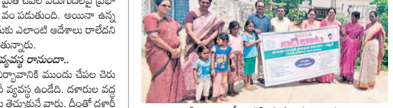
బడిబాట రాష్ట్ర నిర్వహిస్తున్న ఉపాధ్యాయులు