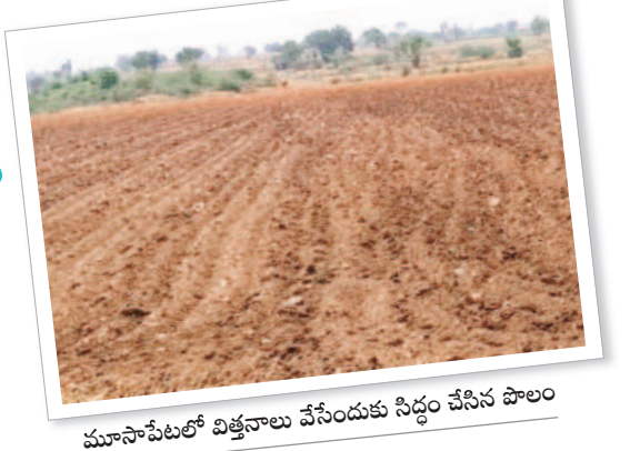
మూసాపేటలో విత్తనాలు వేసేందుకు సిద్ధం చేసిన పొలం

దేవరకర్ల, జూన్ 9: గతేడాది ముందుగా మురిపించిన జాడ లేకుండా పోవడంతో పంటలు చేతికి రాక ఎంతో మంది రైతులు తీవ్రంగా నష్టపోయారు. ఈ ఏడాది సకాలంలో వర్షాలు కురువడంతో సాగు పనులను సరిబరంగా ప్రారంభించారు. దేవరకర్ల మండలంలోని గోపనపల్లి, గుడిబండ, డోకూర్, మినుగోనిపల్లి, జీస్వరాల తదితర గ్రామాల్లో రైతులు పత్తి విత్తనాలు నాలుగున్నారు. విత్తనాలు నాణ్యత పనిలో బీజీగా మారారు. కాగా, కేసీఆర్ సర్కారు వాసకాలం ఆరంభంలోనే రైతులకు పెట్టుబడి సాయం అందించి అండగా నిలువగా, కాంగ్రెస్ ప్రభుత్వం అధికారంలోకి వచ్చాక వారు ప్రకటించిన రైతుభరోసా ఇప్పటి వరకు ఊస లేదు. దీంతో చాలా మంది రైతులు ప్రైవేటు వ్యవస్థ వద్ద పట్టిక అప్పులు తెచ్చుకొని సాగు చేసుకోవాల్సిన దుస్థితి నెలకొంది.