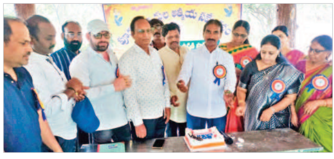
పూర్వవిద్యార్థుల ఆత్మీయ సమ్మేళనం