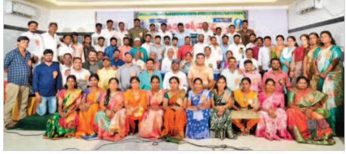
కోల్: సమ్మేళనంలో పాల్గొన్న విద్యార్థులు, ఉపాధ్యాయులు