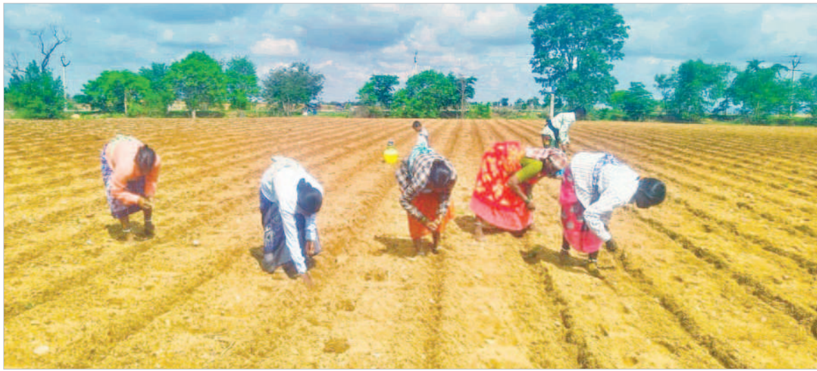
దేవరకర్ల మండలం గోపనపల్లిలో విత్తనాలు విత్తుతున్న రైతులు