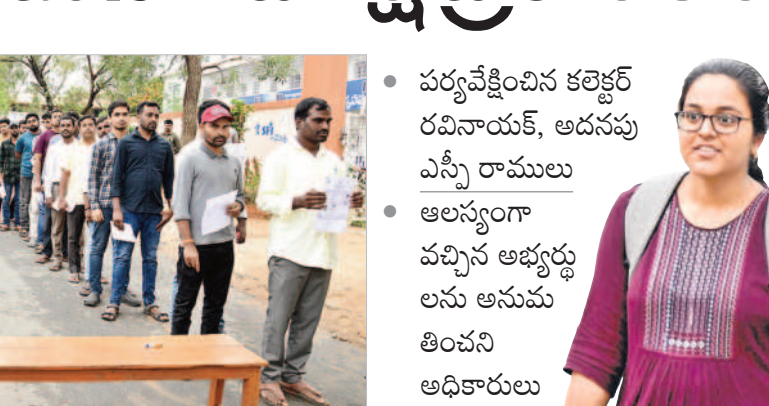
పరీక్ష కేంద్రంలోకి వెళ్లేందుకు క్యూలో నిల్చున్న అభ్యర్థులు