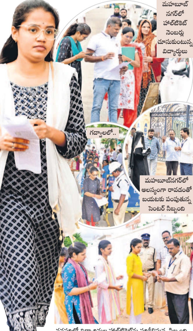
మహబూబ్ నగర్ లో హాల్ టెలికాన్ నిబంధనలను ముందుకు తెచ్చే విద్యార్థులు