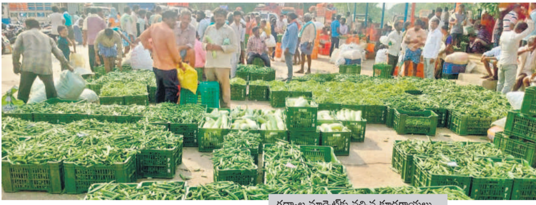
గద్వాల మార్కెట్ కు వచ్చిన కూరగాయలు

సామాన్యులపై భారం పడుతున్నది. రూ.400 కేజీ ధరలో బీన్స్ బెంటెలెత్తిస్తుండగా.. రూ.250 ధరలో చిక్కుడు మక్కలనుంటుండగా.. మిర్చి ఘాటుకు తోడు క్యారెట్, కాకర కేక పెట్టిస్తున్నది. ధరలను నియంత్రించడంలో అధికారులు విఫలమయ్యారు. ఇంత ధరకు మార్కెట్లో వెజిటేబుల్స్ లభ్యమవుతున్నా రైతులకు మాత్రం మద్దతు ధర దక్కడం లేదు. ధరలు పెరగడంతో కూరగాయల జోలికి వెళ్లకుండా ఉన్నదాంటోనే సర్దుకుంటున్నట్లు మహిళలు పేర్కొంటున్నారు.