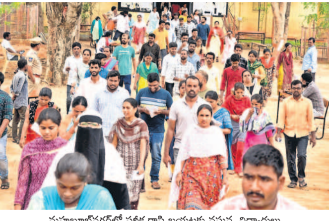
మహబూబ్ నగర్ లో పరిశ్రమ బయటకు వస్తున్న విద్యార్థులు

• ఆరునెలల కిందట ప్రేమవివాహం పాలం వద్దకు వెళ్లి చెట్టుకు ఉర్రేసుకొని ఆత్మహత్య చేసుకున్నారు. సమాచారం అందుకున్న పోలీసులు ఘటనా స్థలానికి వెళ్లి మృతదేహాలను పోస్టుమార్టం నిమిత్తం ఆవుంపేట ప్రభుత్వ వైద్యశాలకు తరలించారు. మృతురాలి తల్లి ఎల్లమ్మ ఫిర్యాదు మేరకు కేసు నమోదు చేసి దర్యాప్తు చేస్తున్నట్లు ఎంపీ ఎల్.ఎం.కొండారెడ్డి తెలిపారు. కాగా గ్రామంలో అవినీతిపట్టుకుంటూ వాళ్లను బండ్లబండ్లు వేసి హతం చేశారని ఘటనా స్థలానికి వెళ్లి చెట్టుకు ఉర్రేసుకొని ఆత్మహత్య చేసుకున్నారు. సమాచారం అందుకున్న పోలీసులు ఘటనా స్థలానికి వెళ్లి మృతదేహాలను పోస్టుమార్టం నిమిత్తం ఆవుంపేట ప్రభుత్వ వైద్యశాలకు తరలించారు. మృతురాలి తల్లి ఎల్లమ్మ ఫిర్యాదు మేరకు కేసు నమోదు చేసి దర్యాప్తు చేస్తున్నట్లు ఎంపీ ఎల్.ఎం.కొండారెడ్డి తెలిపారు. కాగా గ్రామంలో అవినీతిపట్టుకుంటూ వాళ్లను బండ్లబండ్లు వేసి హతం చేశారని ఘటనా స్థలానికి వెళ్లి చెట్టుకు ఉర్రేసుకొని ఆత్మహత్య చేసుకున్నారు.