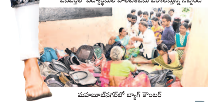
వనస్రతిలో విద్యార్థులకు హాల్ టెలికాన్ నిబంధనలను తెలిపారు