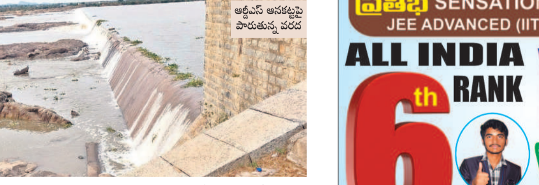
అర్ధివన ఆనకట్టపై పారుతున్న వరద