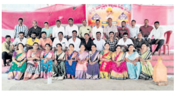
ఆత్మీయ సమ్మేళనంలో పాల్గొన్న పూర్వ విద్యార్థులు

భిక్కనూరు, జూన్ 9 : భిక్కనూరు మండలంలోని తిప్పాపూర్లో పూర్వ విద్యార్థుల ఆత్మీయ సమ్మేళనాన్ని ఆదివారం నిర్వహించారు. 2003-04 సంవత్సరానికి చెందిన పదే తరగతి జిల్లా పరిషత్ ఉన్నత పాఠశాల విద్యార్థులు 20 ఏండ్ల తర్వాత ఒకే వేదికపై చేరుకొని తమ అనుభూతులను పంచుకున్నారు. ఈ సందర్భంగా తమకు విద్యాబుద్ధులు చేర్చిన ఉపాధ్యాయులను శాలువా కట్టి ఘనంగా సత్కరించారు.