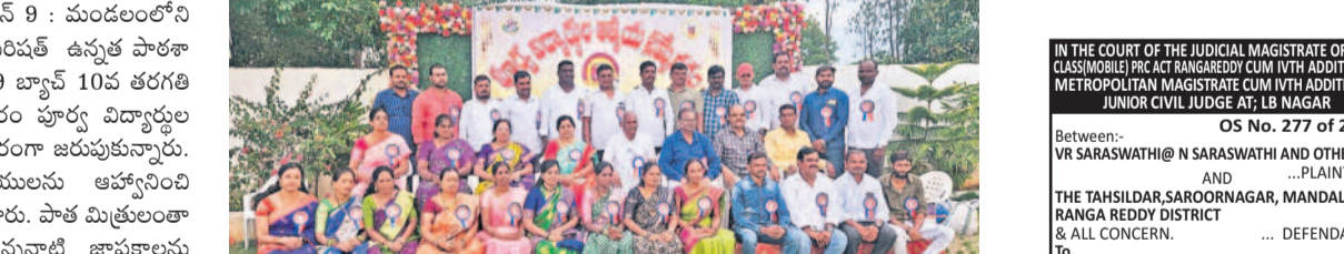
సమ్మేళనంలో పాల్గొన్న రామలూరు పాఠశాల పూర్వ విద్యార్థులు, ఉపాధ్యాయులు

కందుకూరు, జూన్ 9 : మండలంలోని రామలూరు జిల్లా పరిషత్ ఉన్నత పాఠశాలలో 1998-1999 బ్యాచ్ 10వ తరగతి విద్యార్థులు ఆదివారం పూర్వ విద్యార్థుల సమ్మేళనాన్ని నిర్వహించారు.