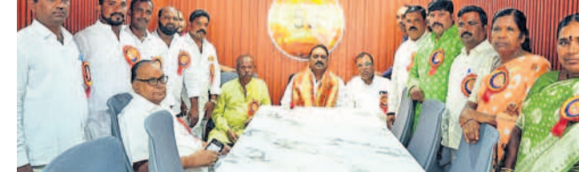
ఎమ్మెల్యే ప్రకాశ్ గౌడ్ ను సన్మానిస్తున్న పాదుపు సంఘం సభ్యులు

మైలారెడ్డిపల్లి, జూన్ 9 : కలిసికట్టుగా ఉంటే ఆర్థికంగా అభివృద్ధి చెందొచ్చని రాజేంద్రగర్ ఎమ్మెల్యే టి.ప్రకాశ్ గౌడ్ అన్నారు.