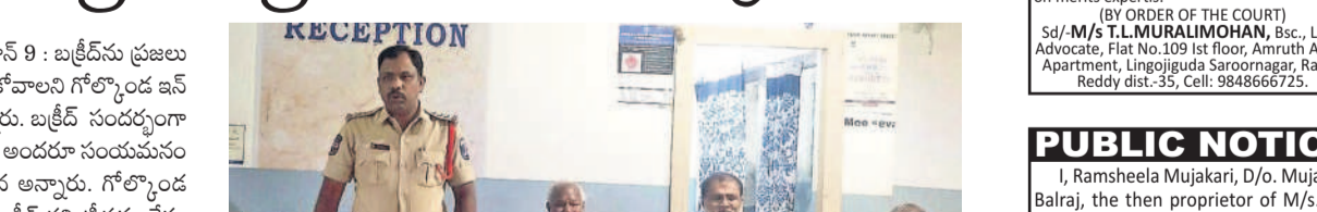
మహిషాసుందరి జూన్ 9 : బక్రీద్ ను ప్రజలు ప్రశాంతంగా జరుపుకోవాలని గోల్కొండ డివిజన్ స్పెక్టర్ సైదులు అన్నారు.