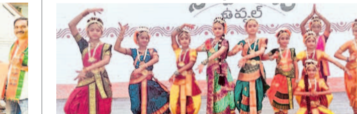
ఉప్పల్, జూన్ 9 : వారంతపు సాంస్కృతిక కార్యక్రమంలో భాగంగా ఉప్పల్ లోని శిల్పాలయంలో అభివృద్ధి అండ్ నాట్య సంఘం నృత్యప్రదర్శన ఎంతానో అకట్టుకుంది.