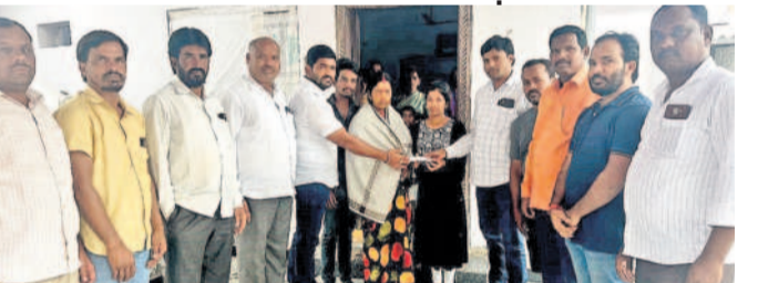
శేఖర్ కుటుంబసభ్యులకు ఆర్థిక సాయం అందజేస్తున్న బాల్యమిత్రులు

కందుకూరు, జూన్ 9 : తమతోపాటి చదువుకున్న స్నేహితుడు అకాల మృతి చెందడంతో బాల్య మిత్రులు ఆతడి కుటుంబానికి ఆర్థిక సాయమందించి అండగా నిలిచారు.