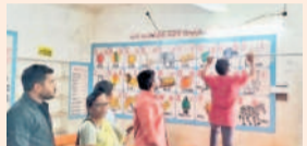
గంధంగూడ ప్రభుత్వ పాఠశాలలో మరమ్మతులను పరిశీలిస్తున్న కమిటీ సభ్యులు

బండగూడ, జూన్ 9 : త్వరలో బడులు ప్రారంభమవుతుండటంతో ప్రభుత్వ పాఠశాలలో మరమ్మతులు ప్రారంభించారు.