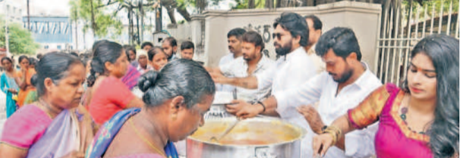
నీలోపర్ ఆసుపత్రి వద్ద అన్నదానం చేస్తున్న రెడీ టూ సర్వీస్ ఫౌండేషన్ ప్రతినిధులు