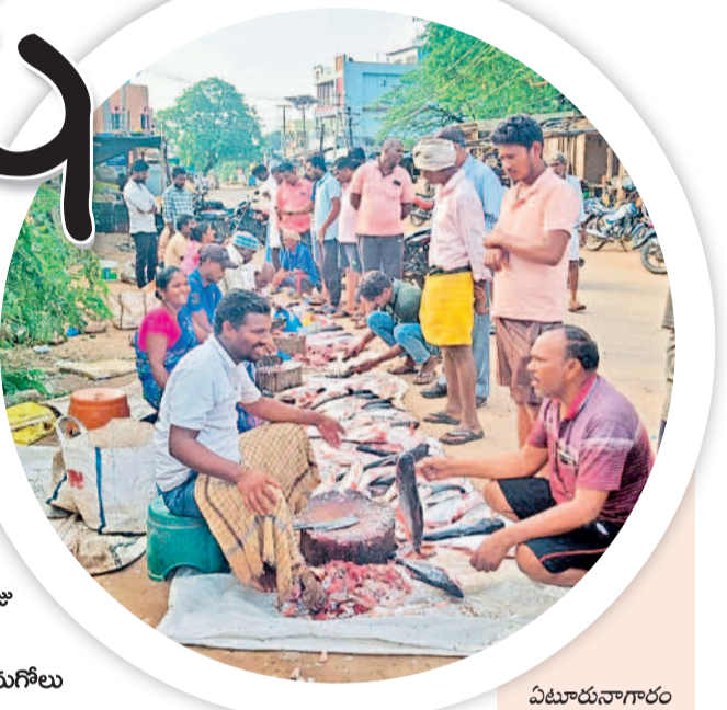
ఏటూరునాగారం మండల కేంద్రంలోని చేపల మార్కెట్ వద్ద కొనుగోలు దారులు

మృగశిర కార్తె సంధర్ంగా మార్కెట్లు, చెరువులు, కుంటల వద్ద సందడి నెలకొంది. మృగశిర కార్తె రోజు చేపలను తినడం వల్ల వ్యాధులు దరిచేరవని ప్రజల నమ్మకం. ఈ నేపథ్యంలో శనివారం చేపలను కొనుగోలు చేసేందుకు ఉమ్మడి జిల్లావ్యాప్తంగా ప్రజలు సమీప చెరువులు, కుంటలతోపాటు పట్టణాలు, నగరాల్లో మార్కెట్లకు బారులు తీరారు. తెల్లవారుజాము నుంచే ప్రజలు ఆయా చెరువుల వద్దకు వెళ్లి చేపల కొనుగోలు చేశారు. డిమాండ్ ను బట్టి మత్స్య శ్రామి, వ్యాపారులు చేపలను ఎక్కువ ధరకు విక్రయించారు.