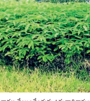
విచారణ చేయించేందుకు ఉన్నతాధికారులు సిద్ధమవుతున్నట్లు తెలిసింది.

మహబూబాబాద్ జూన్ 8 (నమస్తే తెలంగాణ) : పచ్చిరొట్ట విత్తనాల పంపిణీలో అక్రమాలు ఒక్కొక్కటిగా బయటకు వస్తున్నాయి. ఇప్పటికే మహబూబాబాద్ జిల్లాలోని తొర్రూరులో అధికారితోపాటు ముగ్గురు సిబ్బందిపై రాష్ట్ర ప్రభుత్వం సస్పెన్షన్ వేటు వేసింది. తొర్రూరు మండలంలో పెద్ద ఎత్తున పచ్చిరొట్ట విత్తనాల పంపిణీలో డిల్లర్లు, అడికారులు కుప్పకై వాటిని సల్లగొండ జిల్లాకు పంపించినట్లు ఉన్నతాధికారుల విచారణలో తెలిసింది. నేరుగా డిల్లర్లకు పాస్ పోర్ట్, యాజర్ ఐడీ ఇచ్చి ఇష్టానుసారంగా లెక్కలు తారుమారు చేశారు. సుమారుగా 3 బస్సుల విత్తనాలను ఇతర జిల్లాలు బ్లాక్ మార్కెట్లకు తరలించినట్లు అధికారుల దృష్టికి వచ్చింది. ఇదే తరహాలో ముంపుడ మండలంలో కూడా అక్రమాలు జరిగినట్లు ప్రాథమికంగా అంచనా వేశారు. జిల్లా వ్యాప్తంగా అన్ని మండలాల్లో