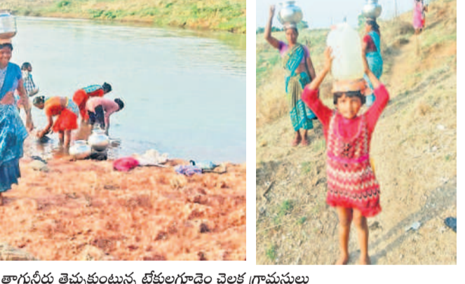
గోదావరి నదిని తాగునీరు తెప్పకుంటున్న టేకులగూడెం చెలక గ్రామస్థులు