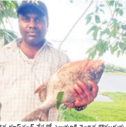
అరుదైన రూపంలో చేపతో ఎలుకులకి చెందిన కొమరయ్య