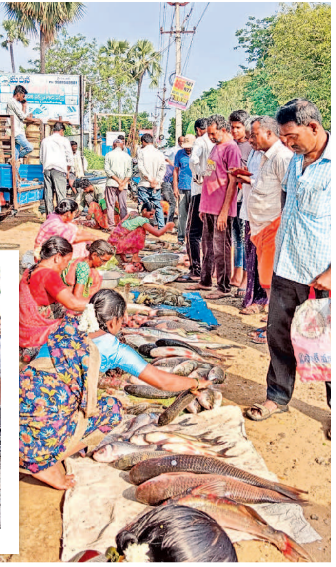
జయశంకర్ భూపాలపల్లి జిల్లా కేంద్రంలోని చేపల మార్కెట్లో భారీగా తరిగివచ్చిన జనావా