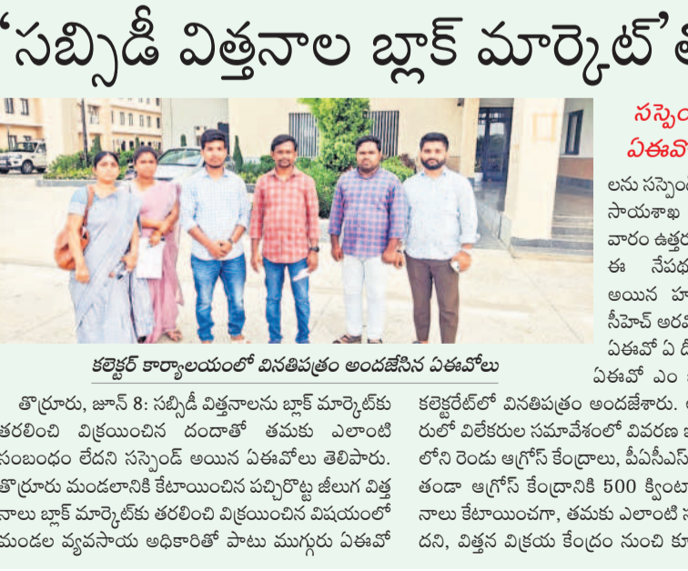
కలెక్టర్ కార్యాలయంలో వినతిపత్రం అందజేసిన ఏకవోలు

తొర్రూరు, జూన్ 8 : సబ్సిడీ విత్తనాలను బ్లాక్ మార్కెట్లకు తరలించి విక్రయించిన దండాతో తమకు ఎలాంటి సంబంధం లేదని సస్పెన్షన్ అయిన ఏకవోలు తెలిపారు. తొర్రూరు మండలానికి కేటాయించిన పచ్చిరొట్ట జిల్లా విత్తనాలు బ్లాక్ మార్కెట్లకు తరలించిన విషయంలో మండల వ్యవసాయ అధికారితో పాటు ముగ్గురు ఏకవోలు