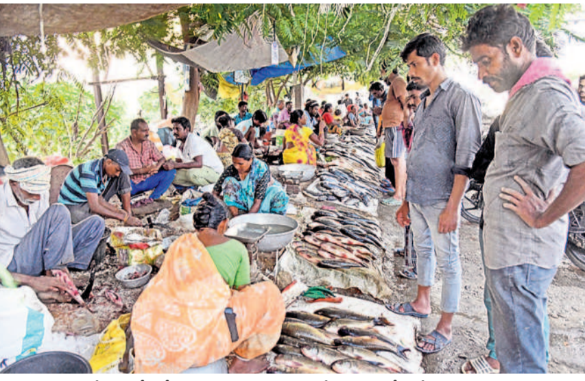
తేయా రోడ్లో హనుమకొండ నగర ట్రిబ్లీ వద్ద చేపల కొనుగోలు చేస్తున్న ప్రజలు