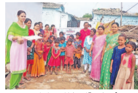
ధారూరు: నాగనమందర్ గ్రామంలో బడిబాట కార్యక్రమం