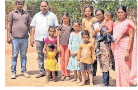
మర్నాటికి విద్యార్థులతో ఉపాధ్యాయులు