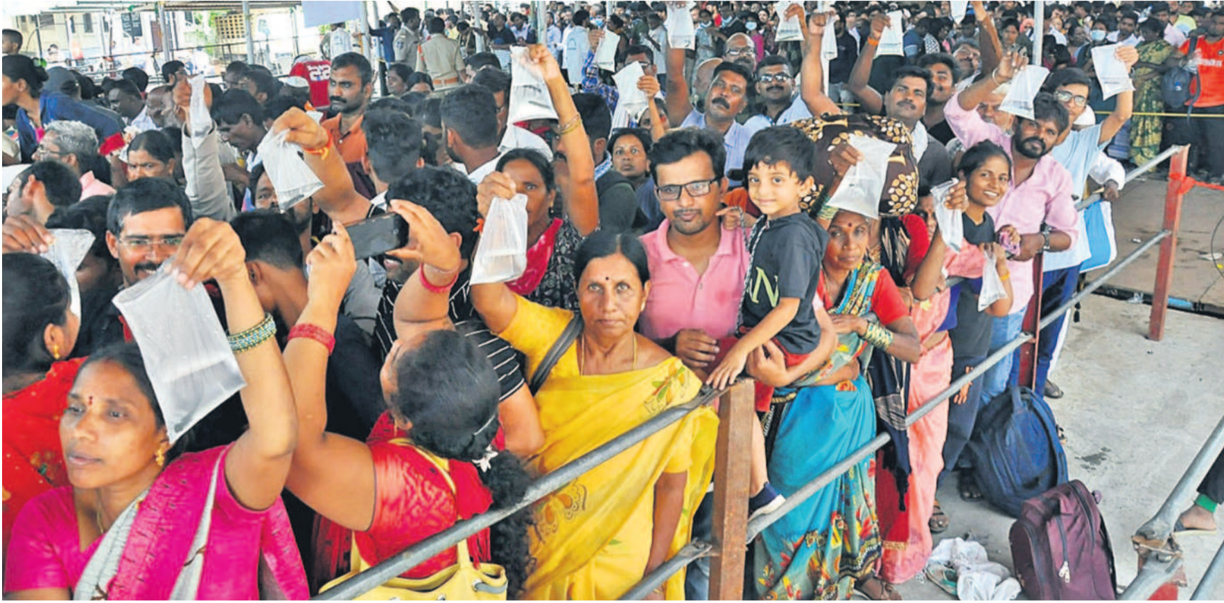
శనివారం నాంపల్లి ఎగ్జిబిషన్ మైదానంలో చేప ప్రసాదం కోసం కొర్రమ్మలతో కూర్చున్న అమ్మల సమూహం