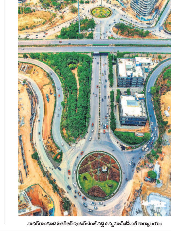
నాన్ కెరాంగూడ టెండర్ ఇంటర్చేంజ్ వద్ద ఉన్న హెచ్జీసీఎల్ కార్యాలయం