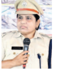
-జనకి ఫైల, ఎస్సీ, నిర్మల్

నిర్మల్ జిల్లాలోని గ్రూప్-1 పరీక్షా కేంద్రాల వద్ద అవాంఛనీయ ఘటనలు చోటు చేసుకోకుండా ఉండేందుకు జిల్లా పోలీసు శాఖ అభ్యర్థులతో చర్యలు తీసుకున్నాయి. ఇప్పటికే కేంద్రాల వద్ద 144 సెక్యూరిటీ అవులు పరిచారు. ప్రత్యేక నిఘా ఏర్పాటు చేసి, జనాలు గుమిగూడకుండా చర్యలు చేపట్టారు. కేంద్రాల్లో నిబంధనలు ఉల్లంఘించిన వారిపై చర్యలు తీసుకుంటారు.