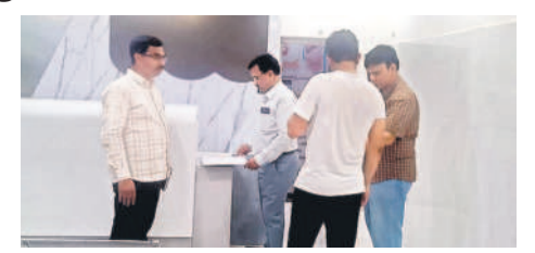
నిర్మల్ లో ఆసుపత్రుల తనిఖీ చేస్తున్న అధికారులు