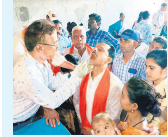
గూళికలను పంపిణీ చేస్తున్న యువరాజ్ వైద్య దంపతులు

ఎదులాపురం, జూన్ 8 : మృగశిర కార్కెను పురస్కరించుకుని ఉబ్బసం వ్యాధి నియంత్రణ కోసం రోగ నిరోధక శక్తిని పెంచడానికి అందించే ఆయుర్వేదిక్ మందు పంపిణీ కార్యక్రమం వెళ్ల వత్తున సాగింది. ఆదిలాబాద్ జిల్లా కేంద్రంలోని సీసీబి క్రాస్ రోడ్డు సమీపంలో గల వైద్య ఆయుర్వేదిక్ రిసెన్స్ సెంటర్ లో పంపిణీని నిర్వహించగా ప్రజలు భారీ సంఖ్యలో తరలివచ్చారు. యువరాజ్ వైద్య దంపతులు, కుటుంబీకులు పూజలు చేసిన అనంతరం ప్రజలకు గూళికలను పంపిణీ చేశారు. వెళ్లలకు ఆయుర్వేదిక్ మూలికలతో తయారు చేసిన గూళికలను వెయ్యి.. చిన్నారలకు మక్కల మందు చేశారు.