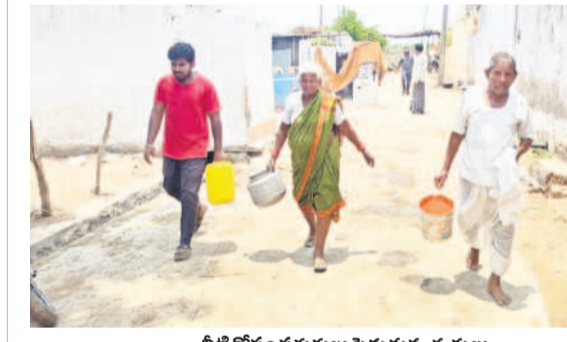
నీటి కోసం పరుగులు పెడుతున్న కవ్వాలు

తాంసి, జూన్ 8 : మండలంలోని చాలా గ్రామాలకు మిషన్ భగీరథ నీరు పూర్తికావడంతో అందరికీ తాగు నీటికి గ్రామీణులు అవ్వవచ్చునని ప్రకటించారు. బావులు, బోర్లలో నీరు అడుగంటిపోతుండడంతో బోరుబావులు అడుగంటిపోయాయి. అధికారులు భగీరథ నీరు అందేలా చూడాలని గ్రామస్తులు కోరుతున్నారు.