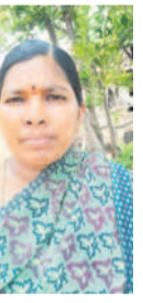
నీటి కోసం ఎప్పుడు రాలే..

పడేశ్ లో ఏం చేసినా లేకుండా తాగడానికి, ఇంటికాటికి భగీరథ నీరు సౌకర్యం లేదు. ఈసారి ఇంటికాడ బోర్లు ఎండిపోయి, ముందు నీళ్ల కోసం మాకు ఎప్పుడు రాలే. ఏడవే ప్రైవేట్ పనిలో భగీరథ నీరు నాలుగు రోజులుగా నీరు రాకపోవడంతో చిన్నా, పెద్దా అనే తేడా లేకుండా మైక్ల దూరం నడిచి నీరు తెచ్చుకుంటున్నారు. గ్రామంలో 500లకు పైగా ఇండ్లకు 400ల అండ్లలో బోరుబావులు అడుగంటిపోయాయి. అధికారులు భగీరథ నీరు అందేలా చూడాలని గ్రామస్తులు కోరుతున్నారు.