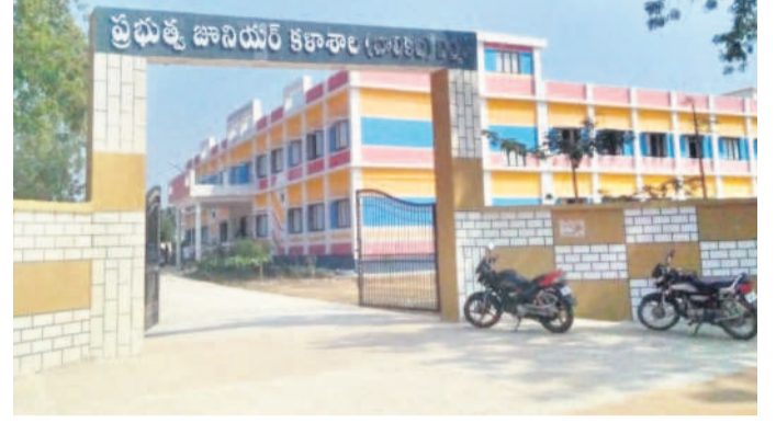
నిర్మల్ పట్టణంలో గ్రూప్-1 పరీక్షా కేంద్రం

ఉత్తర్వులు జారీ చేసింది. దీంతో జిల్లా వ్యాప్తంగా 280 మంది ఉపాధ్యాయులకు వారికి కేటాయించిన స్కూల్స్ లో జాయిన్ కానున్నారు. శనివారం ప్రారంభమైన బదిలీల ప్రక్రియ ఈ నెల 22వ తేదీ ముగియనుంది.