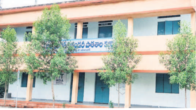
తలమడుగు మండలంలోని కజ్జర్ ప్రభుత్వ పాఠశాల

300 మందికి పైగా ప్రమోషన్లు ఆదిలాబాద్ జిల్లాలో 3,028 మంది ఉపాధ్యాయులు ఉండగా, 2,467 మంది విడుదల నిర్వహిస్తున్నారు. జిల్లా వ్యాప్తంగా ఆయా కేటగిరీల్లో 300లకుపైగా ఖాళీలు ఉండే అవకాశాలున్నాయి. మొదటగా ఎస్సీటీలకు స్కూల్ ఆసి