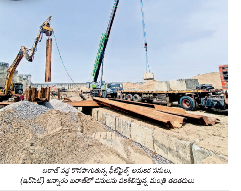
బజార్ వద్ద కొనసాగుతున్న పీల్చెట్ల అలవక పనులు, (ఇన్సెట్) అన్నారం బజార్లో పనులు పరిశీలిస్తున్న మంత్రి తదితరులు