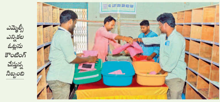
ఎమ్మెల్యే ఎన్నికల ఓట్లను కొంటింగ్ చేస్తున్న సిబ్బంది

పట్టణ ప్రాంతాల్లోనూ ప్రతినిధి చెల్లని ఓట్ల భాగంగా ఉంటుండడం చర్చనీయాంశంగా మారింది. అభ్యర్థులు ప్రచారంలో, సోషల్ మీడియాలో, అభ్యర్థులకు మద్దతుగా ఉండే అంశాలను కచ్చితంగా పట్టణ ప్రాంతాల్లోనూ ప్రచారం చేయడంలో తడబాటుకు గురవుతున్నా ఉన్నారు. ఈ సారి కూడా 27,978 ఓట్లు చెల్లకుండా పోయాయి. మొత్తం ఓట్లలో ఇవి 8.32 శాతంగా ఉన్నాయి. ఇక 2021 మార్చి ఎన్నికల్లో 5.57 శాతం 21,636 ఓట్లు చెల్లకుండా పోయాయి. 2015 మార్చిలో జరిగిన ఎన్నికలను పరిశీలిస్తే 9.14 శాతం 14,039 ఓట్లు చెల్లలేదు. పోస్టల్ బ్యాలెట్ తోనూ సరైన నిబంధనలు పాటించని కారణంగా చలువురి ఓట్లు చెల్లలేదని తెలిసింది.