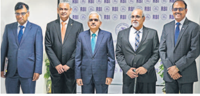
ద్వైమాసిక ద్రవ్యసమీక్ష సందర్భంగా శుక్రవారం ముంబైలో విలేజుల సమావేశానికి వెళ్లేముందు డిప్యూటీ గవర్నర్లతో ఆర్బీఐ గవర్నర్ శక్తికాంత దాస్

ప్రధాన ద్రవ్యోల్బణం 4 శాతం లేదా అంతకంటే తక్కువ కిందికి దిగిపోయే వడ్డీరేట్లను తగ్గించేందుకు వీలుంటుందని ఆర్బీఐ గవర్నర్ శక్తికాంత దాస్ తేల్చి చెప్పారు. ఈ క్రమంలోనే సంవత్సరం బ్యాంక్ నిర్ణయాలు ద్రవ్యోల్బణ లక్ష్యాలకు లోబడి కొనసాగుతాయని మరోమారు ఆయన స్పష్టం చేశారు. ఆర్బీఐ ద్రవ్యసమీక్ష అనంతరం విలేజులలో మాట్లాడుతూ ద్రవ్యోల్బణం తగ్గుతున్నట్లు తగ్గి మళ్ళీ పెరుగుతుండటం ఒకేసారి అందోళనకరమైనట్లు అమెరికా ఫెడ్ రిజర్వ్ వడ్డీరేట్లను తగ్గించినా.. ఇక్కడ ద్రవ్యోల్బణం అదుపులోకి రాకపోతే వడ్డీరేట్ల కోతలకు ఆస్కారం ఉండకపోవచ్చున్నారు. కాగా, ఆన్లైన్ పేమెంట్ లావాదేవీల్లో అవాంఛన వల్ల కాదని గవర్నర్ దాస్ ఈ సందర్భంగా చెప్పారు. ఇక దేశంలో బంగారం నిల్వలు పెరుగుతున్నా.. ఇంకా పుత్రడి నిల్వలకు కావాల్సినంత చోటుండని, అందుకే ఇంగ్లండ్లో పెట్టిన 100 మిల్లికే బిల్లులను పనిపెట్టి ఇటీవల భారతీయ తీసుకొచ్చామని దాస్ తెలిపారు. అంతే తప్ప దీని వెనుక మరో కారణమేమీ లేదని తెలియజేశారు.