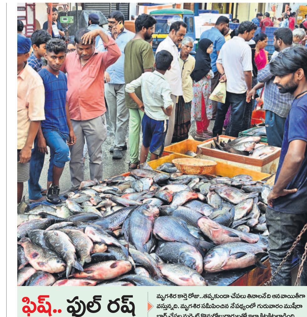
మృగశిర కార్పె రోజు.. తప్పకుండా చేపల తినినానేది అనాయిత్ గా వస్తున్నది. మృగశిర సమీక్షించిన సేవద్వారా గురువారం ముమ్మారు బాద్ చేపల మార్కెట్ కొనుగోలుదారులతో ఇలా కిక్కిరిసింది.

సిటీబ్యూరో, జూన్ 6 (నమస్తే తెలంగాణ) : ఓయూలో ప్రొఫెసర్ గా పనిచేసి రిటైర్ అయిన 80 ఏండ్ల వృద్ధుడికి టిబిపోస్ డిపార్ట్మెంట్ సుందరి మాట్లాడుతున్నాంటూ కాలీ వచ్చింది.. 'మీ పేరుతో రెండు మొబైల్ నంబర్లున్నాయి.. రెండో మొబైల్ నంబర్ అండర్ లోని వెస్ట్ ముంబై అక్షరాలతో ఉండంటూ మాట్లాడుతూ.. తనకు ఒకటి ఫోన్ నంబర్ ఉన్నదని, రెండో నంబర్ ఎవరిదో తనకు తెలియదంటూ బాధితుడు ఎంత చెప్పినా.. ఫోన్లో మాట్లాడేవాళ్లు వినలేదు. 'మీ పేరుతో మహారాష్ట్రలో కేసు నమోదైంది. ఫలానా నంబర్లో మాట్లాడుకోండి.. వాళ్లు అరెస్టు చేసిన వ్యవహారాన్ని చూసుకుంటారంటూ ఆ నంబర్ చెప్పి ఫోన్ పెట్టారు. ఆ నంబర్ ఫోన్ చేస్తే.. 'మేం సైబర్ క్రైమ్ డిపార్ట్మెంట్ వాళ్లు.. రాష్ట్రం వద్ద మన లాండరింగ్ కేసులో మీకు కనెక్ట్ ఉన్నట్లు అనుమానాలున్నాయి. ముంబైకి మీరు రావాలి వస్తుంది. ఈ కేసు నీవే చూస్తూ దంటూ బాధితుడు చెప్పారు. ఫిర్యాది బాధితుడి రెండు బ్యాంకు ఖాతాల్లోనూ.. 15.86 లక్షల ఫిక్స్ డిపాజిట్లను రద్దు చేయించి.. ఆ డబ్బును తమ ఖాతాల్లో డిపాజిట్ చేయించారు. డబ్బు డిపాజిట్ చేసిన తరువాత వీడియో కాలీ కట్ చేసి సైబర్ నెరగాళ్లు.. మళ్లీ రెండు ఉదయం కాలీ చేస్తూమంటూ నమ్మించి పోస్టు స్విచ్ చేశారు. బాధితుడు ఈ మోసాన్ని గుర్తించి సైబర్ క్రైమ్ పోలీసులకు ఫిర్యాదు చేయడంతో కేసు దర్యాప్తు చేపట్టారు.