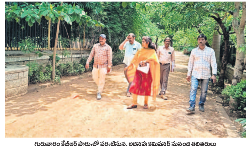
గురువారం కేబీఆర్ పార్కులో వర్షానికి ముందు అందమైన కమిషనరీ సుందర తదితరాలు