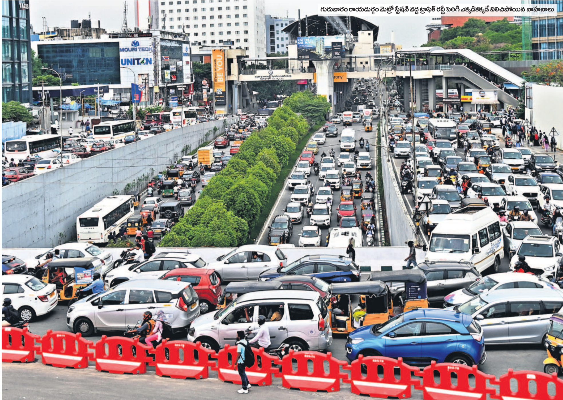
గురువారం రాయదుర్గం మెట్రో స్టేషన్ వద్ద ట్రాఫిక్ రద్దీ పెరిగి ఎక్కడిక్కడో నిలిచిపోయిన వాహనాలు