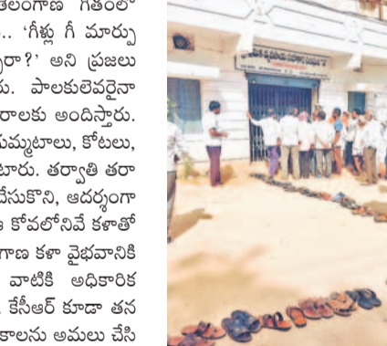
విమర్శలు చేసినప్పటికీ తెలంగాణలో 70 ఏండ్లలో జరగగలిగిన అభివృద్ధి తో ముద్దునిచ్చే రెండో జరిగిందన్నది మాత్రం వాస్తవం.

మరోవైపు కాంగ్రెస్ ఆరు నెలల పాలనలోనే రాష్ట్రం ఆగమగమైంది. ఉమ్మడి పాలనలో ఎదుర్కొన్న కష్టాలు మళ్ళీ తెలంగాణను చుట్టుముడుతున్నాయి. మరీ ముఖ్యంగా రైతుల బాధలు వర్ధ రించుకొంటున్నాయి. కేసీఆర్ హయాంలో జరిగిన తెలంగాణ అభివృద్ధిని యావత్ దేశం కీర్తిస్తుంటే.. కాంగ్రెస్ పాలనకు మాత్రం గౌరవం కాండంకగా చిత్రికరిస్తూ విమర్శలు చేస్తూనే ఉన్నారు. ఎవరెన్ని