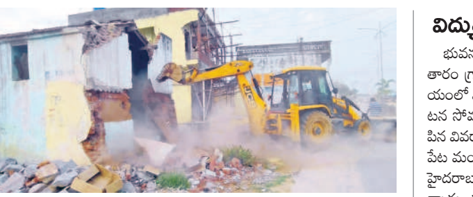
ఇండ్లను తొలగిస్తున్న మున్సిపల్ సిబ్బంది

రోడ్డు విస్తరణ కోసం ఇండ్లను తొలగించుకోవాలి