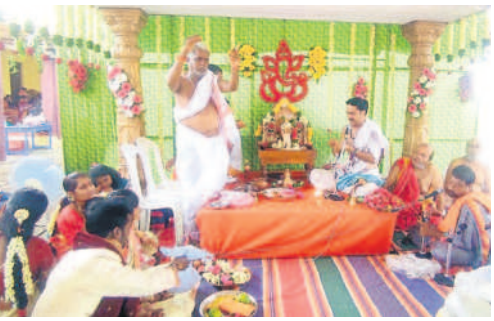
తాళిబోళ్లు చూపుతున్న భ్రాహ్మణులు

తుర్కపల్లి, జూన్ 4 : మండలంలోని కొండాపురంలో గల శ్రీమాతా ఆశ్రమంలో మంగళవారం సర్వశక్తి స్వరూపిని మాతా, సర్వేశ్వర స్వామి కల్యాణ మహోత్సవం వైభవంగా జరిగింది. వేద భ్రాహ్మణుల మంత్రో