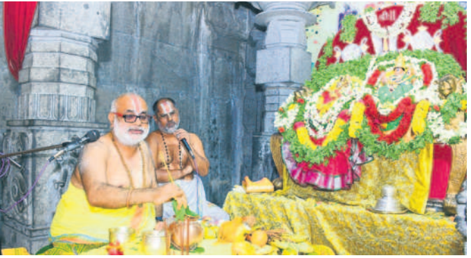
స్వామి, అమ్మవార్ల నిత్య తిరుకల్యాణం జరిపిస్తున్న అర్చకులు

యాదగిరిగుట్ట, జూన్ 4 : యాదగిరిగుట్ట లక్ష్మీనరసింహ స్వామి సుప్రభాత సేవోత్సవం అత్యంత వైభవంగా సాగింది. మంగళవారం తెల్లవారుజామునే ఆలయాన్ని తెరిచిన అర్చకులు సుప్రభాతంతో స్వామివారిని మేల్కొల్పి పారా. అనంతరం తిరువారాధన జరిపి ఉదయం ఆరగింపు చేపట్టారు. ప్రధాన అర్చకులు, అమ్మవార్లకు నిజాభిషేకం