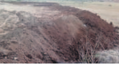
సీసీ వేసేందుకు కాంట్రాక్టర్ తీసిన గొయ్యిలో నిలిచిన మురుగు నీరు

నంగనూరు, జూన్ 4: మండలంలోని మగ్గంపూర్ లోని ఊర చెరువు, అంజ్లా పూర్ లోని సభిచెరువుల నుంచి ఎలాంటి అనుమతి లేకుండా మట్టి తప్పుతున్నాయి. ట్రాక్టర్లతో మట్టిని ఖాళీ స్థలాలు, రే ఆవులకు తరలిస్తూ మట్టిని ట్రాక్టర్లకు రూ.1000 నుంచి రూ.2 వేల వరకు వసూలు చేస్తున్నట్లు సమాచారం. బీఆర్ఎస్ ప్రభుత్వ హయాంలో చెరువుల ఆధునికీకరణ కోసం ఎంతో నిధులు ఖర్చుచేసి మిషన్ కాక తీరు చేరుతో మరమ్మతులు చేపట్టిన విషయం తెలిసింది. విచ్చలవిడిగా జేసిన బీసీ సహాయంతో పెద్ద పెద్ద గుంతలు తీస్తూ చెరువుల అంచాలు కనుమరుగైతే వాస్తూ నూ ఆధికారులు మాత్రం పట్టించుకోవడం లేదు. ఇప్పటికైనా అధికారులు స్పందించి మట్టి మాఫియాపై చర్యలు తీసుకోవాలని ఆయా గ్రామస్థులు కోరుతున్నారు.