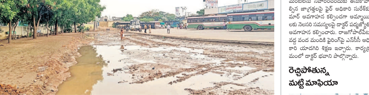
బురద, మురుగునీటి మధ్య హుస్సాబాద్ అర్జీని బస్టాండ్

దుర్గంపై వెదజల్లుతున్న హుస్సాబాద్ అర్జీని బస్టాండ్