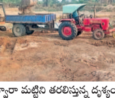
ట్రాక్టర్ ద్వారా మట్టిని తరలిస్తున్న దృశ్యం

నంగనూరు, జూన్ 4: మండలంలోని మగ్గంపూర్ లోని ఊర చెరువు, అంజ్లా పూర్ లోని సభిచెరువుల నుంచి ఎలాంటి అనుమతి లేకుండా మట్టి తప్పుతున్నాయి. ట్రాక్టర్లతో మట్టిని ఖాళీ స్థలాలు, రే ఆవులకు తరలిస్తూ మట్టిని ట్రాక్టర్లకు రూ.1000 నుంచి రూ.2 వేల వరకు వసూలు చేస్తున్నట్లు సమాచారం. బీఆర్ఎస్ ప్రభుత్వ హయాంలో చెరువుల ఆధునికీకరణ కోసం ఎంతో నిధులు ఖర్చుచేసి మిషన్ కాక తీరు చేరుతో మరమ్మతులు చేపట్టిన విషయం తెలిసింది. విచ్చలవిడిగా జేసిన బీసీ సహాయంతో పెద్ద పెద్ద గుంతలు తీస్తూ చెరువుల అంచాలు కనుమరుగైతే వాస్తూ నూ ఆధికారులు మాత్రం పట్టించుకోవడం లేదు. ఇప్పటికైనా అధికారులు స్పందించి మట్టి మాఫియాపై చర్యలు తీసుకోవాలని ఆయా గ్రామస్థులు కోరుతున్నారు.