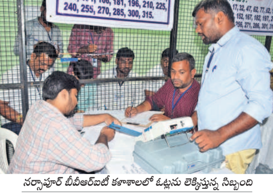
నర్సాపూర్ బీఆర్ఎస్ కళాశాలలో ఓట్లను లెక్కిస్తున్న సిబ్బంది