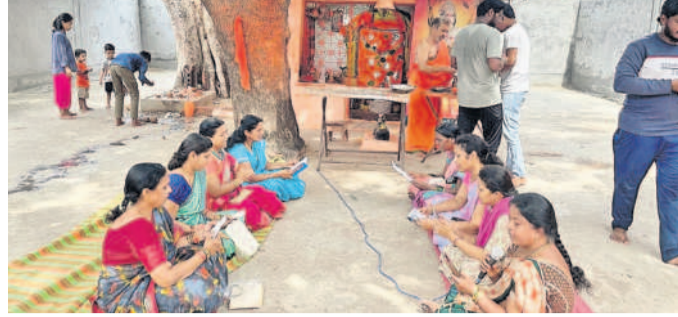
హనుమాన్ ఆలయంలో హనుమాన్ చాలీసాపారాయణం చేస్తున్న మహిళలు