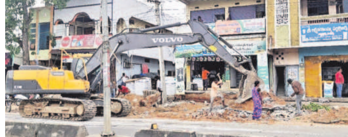
హుస్సాబాద్ పట్టణంలో జోనీటితో సాగుతున్న విస్తరణ పనులు

హుస్సాబాద్లోని, జూన్ 4: పార్లమెంట్ ఎన్నికల ప్రక్రియ ముగిసిన వెంటనే హుస్సాబాద్ పట్టణం నుంచి వెళ్ళే జాతీయ రహదారి పనులు వేగవంతం చేశారు. ఎల్లెత్తురు నుంచి మెడకవెళ్ళే జాతీయ రహదారి పనులు అన్ని ప్రాంతాల్లో నిర్వహించినప్పటికీ పట్టణంలో విస్తరణ పనులు చేపట్టలేదు. రహదారికి ఇరు వైపులా ఉన్న భవనాలకు నష్టం జరగకుండా రహదారి పనులు చేపట్టాలని అధికారులు వ్యాపారస్తులు నాయకులు, అధికారులకు విజ్ఞప్తి చేశారు. విస్తరణ పనులు చేపడితే ఎన్ని కల్లో ఇబ్బందులు తప్పవని పార్లమెంట్ ఎన్నికలు ముగిసే వరకు పనులను ఎండింగ్ తో