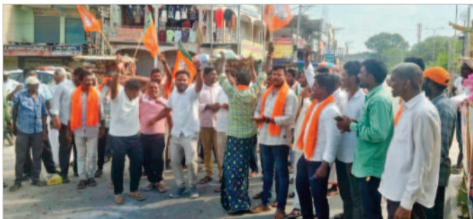
మక్రల్లో సమ్మరాలు నిర్వహిస్తున్న నాయకులు

మరకల్, జూన్ 4 : జిల్లాలో ఆ స్త్రీ మండలంలో మహబూబ్ నగర్ పార్లమెంట్ నుంచి బీజేపీ అభ్యర్థి డి.కె.ఎం.ఎం. సాధించారు. డి.కె.ఎం.ఎం. మంగళవారం పార్టీ నాయకులు సమ్మరాలు నిర్వహించారు. ఆయా ప్రాంతాల్లో ప్రధాన చౌరస్తాల్లో పటాకులు కాలుస్తూ, మి