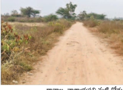
రాచాల, నాగాయపల్లి మట్టి రోడ్డు

మూసాపేట (అడ్డంకుల), జూన్ 4 : రెండు మండలాలను అనుసంధానం చేసే రోడ్డును బీటీగా మార్చేందుకు మోక్షమెప్పుడు వస్తుందోనని ప్రజలు ఎడరు చూస్తున్నారు.