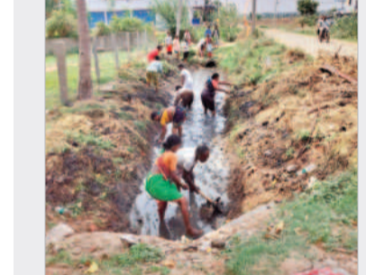
కాల్యంలో పూడిక తీస్తున్న ఉపాధి హామీ పనులు

కృష్ణ, జూన్ 4 : మండలంలో మహాత్మాగాంధీ గ్రామీణ ఉపాధి హామీ పథకం పనులు ముమ్మరంగా కొనసాగుతున్నాయి. మంగళవారం మండలంలోని గుండెలూర్ లో పొడవ వద్ద కలుపు మొక్కలు తొలగించడం, మొక్కలు నాచోడుకు గుంతలు తవ్వడం, కాల్యంలో పూడిక తీయడం పనులను చేపట్టారు. జాబ్ కార్డు కలిగిన వారు ఉపాధి హామీ పనులను సర్దిబియోగం చేసుకోవాలని అధికారులు సూచించారు.