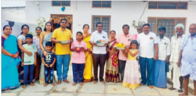
అమ్మవారికి పట్టువస్త్రాలు సమర్పిస్తున్న మొగగన్ కుటుంబ సభ్యులు

నారాయణపేట రూర్, జూన్ 4 : మండలంలోని జాభూర్లో మంగళవారం గజలమ్మ జాతర ఘనంగా నిర్వహించారు. భక్తులు అమ్మవారికి ప్రత్యేక పూజలు చేశారు. వంశపరంగా వస్తున్న ఆచారం మొగగన్ జనాధర్ కుటుంబ సభ్యులు అమ్మవారికి