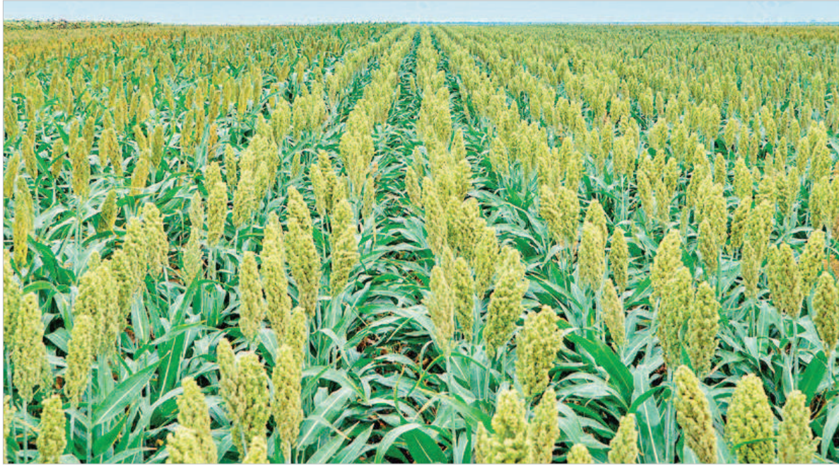
మూసాపేట శివారులో సాగుచేసిన జొన్నపంట (ఫైల్)