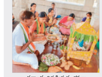
ప్రతాపం నిర్వహిస్తున్న భక్తులు

దేవరకర్ల, జూన్ 4 : మండలంలోని బస్ స్టాండ్ లో బోనాలు ప్రతిష్ఠాపనలో భాగంగా మంగళవారం గ్రామీణ వేదవేదం ఉత్సవాలను ప్రజలు భక్తిశ్రద్ధలతో జరుపుకోన్నారు. మహిళలు బోనాలతో బోనాలుకి ప్రత్యేక పూజలు చేసి మొక్కులు తీర్చుకున్నారు. అదేవిధంగా మహిళలు బోనాలతో గ్రామ పురమీదల గూండా రాల్చిగా వచ్చి బోనాలు పుట్టు ప్రదక్షిణలు చేసి అనంతరం అమ్మవారికి వైభవం సమర్పించారు.