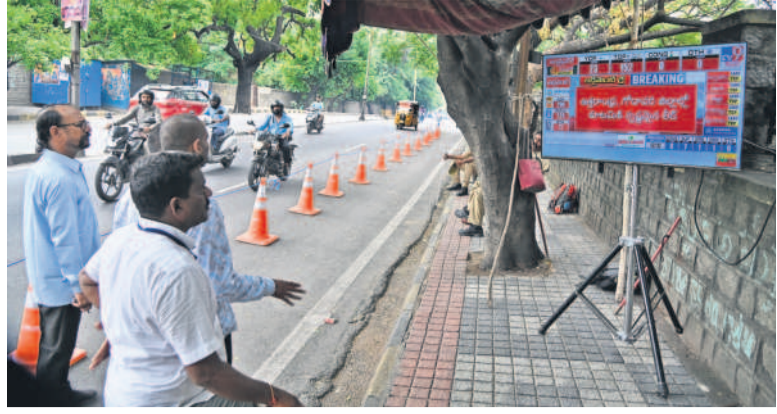
మంగళవారం పార్లమెంట్ ఎన్నికల ఫలితాలను గురించి తెలుగు ప్రజలకు తెలియజేసే ప్రయత్నం చేస్తున్న నగరవాసులు