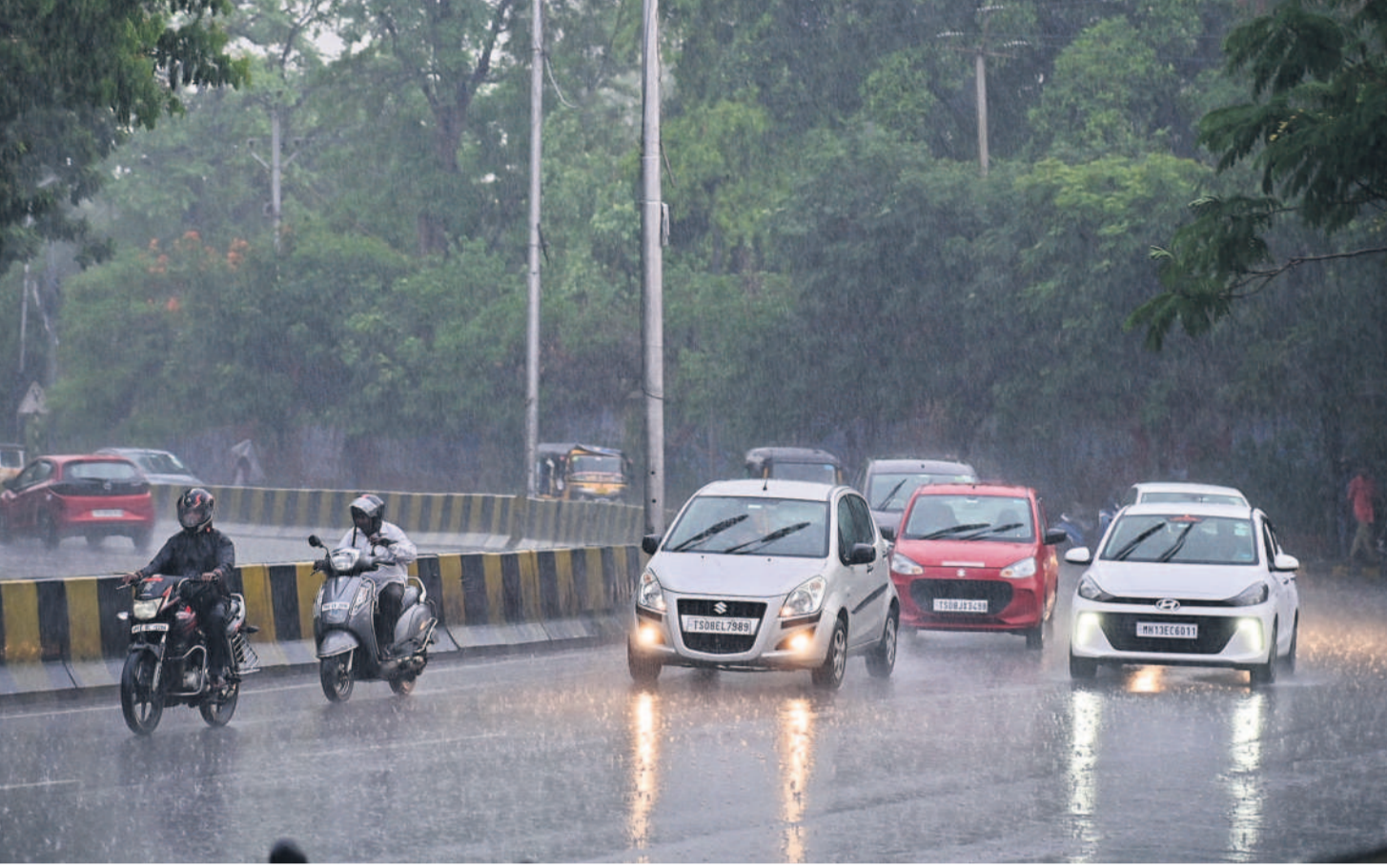
చుట్టిన సాయంత్రం.. మంగళవారం మధ్యాహ్నం వరకు ఎండ దండలాడింది. దీంతో నగరవాసులు ఎండ వేడిని తట్టుకోలేక ఇబ్బందులు పడ్డారు. ఆ వెంటనే సాయంత్రం వర్షం కురువడంతో కాస్త సుఖపడటం చెందారు.

వర్షాకాలంలో నిరంతరాయంగా పర్యవేక్షణ సీట్ బ్యూరో, జూన్ 4 (నమస్తే తెలంగాణ): భారీ వర్షాలతో ముప్పు సమస్యలే కాదు... గ్రేటర్ హైదరాబాద్ పరిధిలో విద్యుత్ సరఫరాలో అంతరాయాలు ఎక్కువగానే ఉంటాయి. ఈ సేపట్లో మొదలైన విద్యుత్ సరఫరాను అందించేందుకు దక్షిణ తెలంగాణ విద్యుత్ సంపిణి సంస్థ ప్రత్యేకంగా చర్యలు తీసుకుంటోంది. గ్రేటర్ పరిధిలో కరువున్న చర్చాల సేపట్లో విద్యుత్ సరఫరాపై ఉన్న అడ్డంకులు అప్రమత్తంగా ఉండాలని ఇప్పటికే ఆదేశాలు జారీ చేశారు. మొత్తం 9 సర్కిళ్ల పరిధిలో క్షేత్ర స్థాయిలో ప్రత్యేక బృందాలు పర్యవేక్షణ చేపట్టాలని, ఎక్కడ విద్యుత్ సరఫరాలో అంతరాయం కలిగినా యుద్ధ ప్రాతిపదికన సరఫరాను పునరుద్ధరించాలని సూచించారు. ముఖ్యంగా ఈ వర్షాకాలంలో ఆయా సర్కిల్ కార్యాలయాల్లో ప్రత్యేక కంట్రోల్ రూమ్లను ఏర్పాటు చేసుకొని పగలు, రాత్రి వేళల్లో పర్యవేక్షణ చేయాలన్నారు. ఆయా ప్రాంతాల నుంచి విద్యుత్ సరఫరాపై వస్తున్న సమాచారాలను పరిశీలిస్తూ, వాటిని తగ్గరితగ్గిన పునరుద్ధరించేందుకు సిద్ధంగా ఉండాలని సూచనలు చేశారు. వర్షాలు కురిసే సమయంలో విద్యుత్ పర్యవేక్షణ కోసం స్కాడ్లోనూ ప్రత్యేక కంట్రోల్ రూమ్లను ఏర్పాటు చేసి అంతరాయం ఎక్కడ ఉందో తెలుసుకొని అక్కడ పునరుద్ధరించేలా అధికార యంత్రాంగం నిరంతరం అప్రమత్తంగా ఉండేలా ఏర్పాటు చేస్తున్నారు.