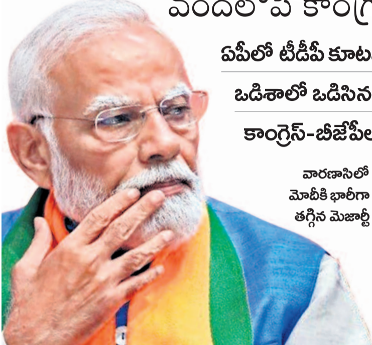
వారణాసిలో మోదీకి భారీగా తగ్గిన మెజార్టీ

లోక్ సభ ఎన్నికల్లో మ్యూజిక్ ఫిగర్ దాటని బీజేపీ.. తీన్ సౌ చేరని ఎన్ డీయే వందలోపే కాంగ్రెస్.. మిత్రులతో కలిపి 233.. ఓటరు విలక్షణ తీర్పు ఏపీలో టీడీపీ కూటమి ఘన విజయం.. జగన్ భావోద్వేగం.. రాజీనామాను ఆమోదించిన గవర్నర్ ఒడిశాలో ఓడిసిన నవీన్ పట్నాయక్ శకం.. తెలంగాణలో జాతీయ పార్టీలకే దక్కిన ఎంపీ సీట్లు కాంగ్రెస్-బీజేపీలకు చెరో 8.. హైదరాబాద్ మజ్లీస్ కే.. బీఆర్ఎస్ కు దక్కని లోక్ సభ స్థానాలు