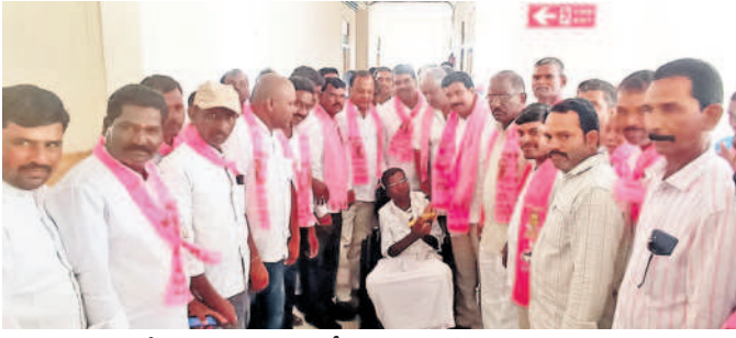
కొడంగల్ : రోగులకు పండ్లు పంపిణీ చేస్తున్న మాజీ ఎమ్మెల్యే వట్లం నరేందర్ రెడ్డి