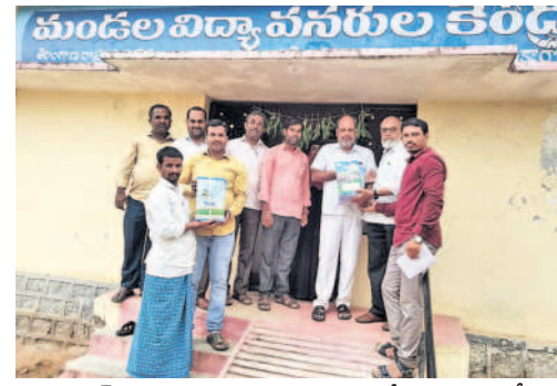
హెచ్ఎంలకు పాఠ్యపుస్తకాలను అందజేస్తున్న ఎంఈవో

కులకర్ణ, జూన్ 3: ప్రభుత్వం ద్వారా పచ్చిన పాఠ్యపుస్తకాలను పంపిణీ చేస్తున్నట్లు కులకర్ణ ఎంఈవో అబ్దుల్ హమీద్ అన్నారు. సోమవారం మండల కేంద్రంలో మండల విద్యార్థులను కేంద్రంలో ఆయన పాఠశాల ప్రధానోపాధ్యాయులకు పాఠ్యపుస్తకాలను అందజేశారు. ఈ సందర్భంగా ఆయన మాట్లాడుతూ పాఠశాలలు ప్రారంభానికి ముందుగానే పాఠశాలకు పాఠ్యపుస్తకాలను అందిస్తున్నట్లు తెలిపారు. తరగతుల వారీగా పాఠశాల ప్రధానోపాధ్యాయులకు పాఠ్యపుస్తకాలను అందిస్తున్నట్లు తెలిపారు. ఈ కార్యక్రమంలో వివిధ పాఠశాల ప్రధానోపాధ్యాయులు, సీఆర్ టీఎస్ పాల్గొన్నారు.