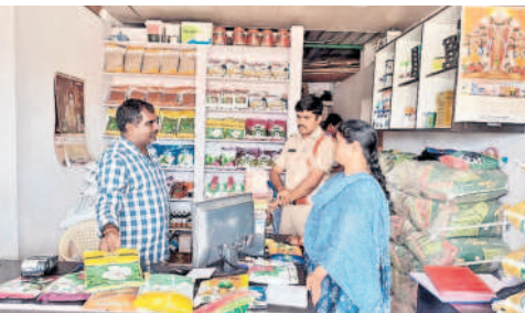
తుంకిమెట్లలోని ఎరువుల దుకాణాన్ని తనిఖీ చేస్తున్న ఎస్ ఐ

వికారాబాద్, జూన్ 3 : పత్తి కొనుగోలు రైతుల వివరాలు రిజిస్ట్రేషన్లో నమోదు చేయాలని మోమినపేట వ్యవసాయాధికారి భూపతి జయశంకర్ అన్నారు. సోమవారం మోమినపేట మండల రైతు వేదికలో వ్యవసాయ శాఖ, పోలీసు శాఖ సంయుక్తంగా మండల డిలరీకు సమావేశం నిర్వహించారు. ఈ సందర్భంగా మండల వ్యవసాయ అధికారి భూపతి జయశంకర్ మాట్లాడుతూ డిలరీ అందడానికి కచ్చితంగా స్టాక్ రిజిస్ట్రేషన్, బిల్ బుక్ కు, స్టాక్ బోర్డు పెట్టి ప్రతిరోజూ అప్డేట్ చేయాలని సూచించారు. ముఖ్యంగా పత్తి విత్తనాలు కొనుగోలు చేసిన రైతుల రిజిస్ట్రేషన్ రాసినప్పుడు ప్రతి రైతు ఫోన్ నంబర్ తప్పనిసరిగా నమోదు చేయాలని సూచించారు. ఆ ఫోన్ నంబర్ సాయంతో వ్యవసాయ అధికారులు రైతులతో ప్రత్యక్షంగా మాట్లాడి విత్తనాలు ఏ రైతుకు తీసుకున్నారు? పంట ఎలా ఉన్నదో తదితర వివరాలను రైతుల వద్దనుండి సమాచారం సేకరిస్తామని తెలిపారు. రైతులు బిల్లులు లేకుండా విత్తనాలు కొనుగోలు చేయవద్దని సూచించారు. ఎవరైనా నకిలీ విత్తనాలు విక్రయిస్తే కఠిన చర్యలు తీసుకుంటామని హెచ్చరించారు. లైసెన్సులు లేకుండా రాత్రి వేల గ్రామంలో సంచరించిన నకిలీ విత్తనాలు అమ్మారాదని, అటువంటి వ్యక్తులు గ్రామంలో తారసపడితే తక్షణమే సమీప వ్యవసాయ అధికారులకు సమాచారం అందించాలని సూచించారు. కార్యక్రమంలో మోమినపేట వ్యవసాయ విస్తరణ అధికారి వెంకటయ్య పాల్గొన్నారు.