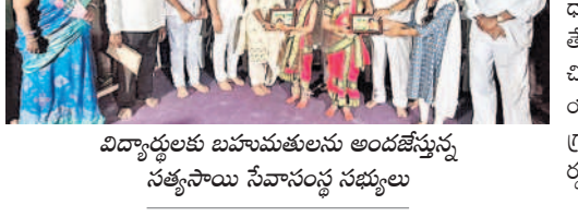
విద్యార్థులకు బహుశుభలను అందజేస్తున్న సత్యసాయి సేవాసంస్థ సభ్యులు