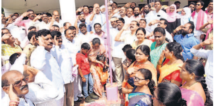
హనుమకొండలో జెండా వందనం చేస్తున్న ఎమ్మెల్యే సారయ్య, దాస్యం, పెద్ది తదితరులు