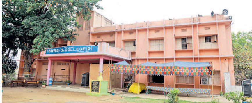
మానుకోట తెలంగాణ సాంఘిక సంక్షేమ గురుకుల పాఠశాలలోని కౌంటింగ్ కేంద్రం

మహబూబాబాద్ లో కేసీసభ సంబంధించి జిల్లాకేంద్రంలోని తెలంగాణ సాంఘిక సంక్షేమ గురుకుల పాఠశాల, జానియర్ కళాశాలలో కౌంటింగ్ కేంద్రాలు ఏర్పాటు చేశారు. పార్లమెంట్ పరిధిలో మొత్తం 15,92,366 మంది ఓటు ధృవండా 11,01,030 ఓట్లు (71.85%) పోలయ్యాయి. భద్రాచలం, పినపాక, ఇల్లెందుల, ములుగు, నర్సంపేట, మహబూబాబాద్, డోర్నకల్ అసెంబ్లీ స్థానాల వేర్వేరుగా కౌంటింగ్ నిర్వహించనున్నారు. ఒక్కో రౌండ్ కు 14 టేబుళ్లు ఏర్పాటు చేశారు. మొత్తం 132 రౌండ్లలో లెక్కింపు ప్రక్రియను పూర్తి చేయనున్నారు. డోర్నకల్ నియోజకవర్గంలో 19 రౌండ్లు, మహబూబాబాద్-21, నర్సంపేట-21, ములుగు-22, పినపాక-18, ఇల్లెందుల-18, భద్రా