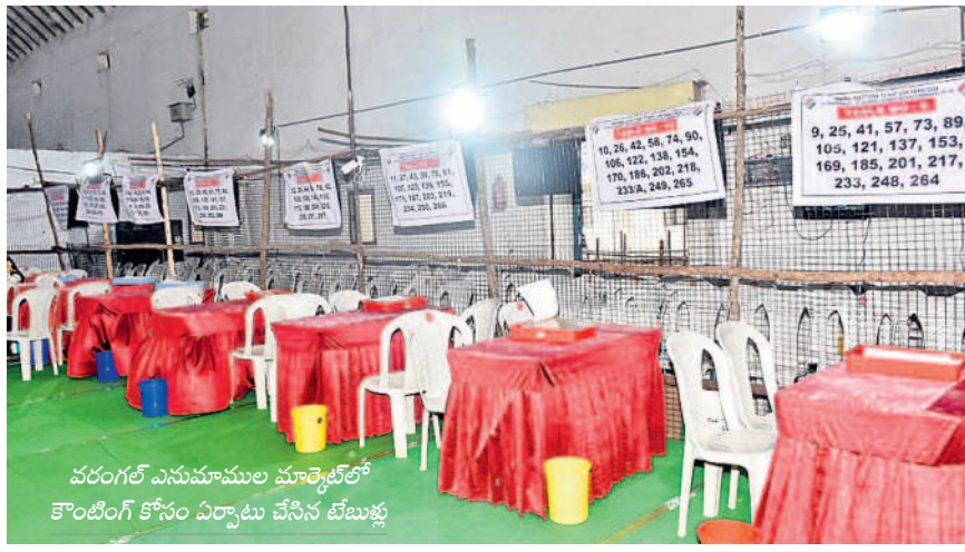
వరంగల్ ఎనుమాముల మార్కెట్లో కౌంటింగ్ కోసం ఏర్పాటు చేసిన టేబుళ్లు