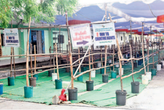
కౌంటింగ్ కోసం చేసిన ఏర్పాట్లు

పార్లమెంట్ ఎన్నికల ఫలితాలపై నెలకొన్న ఉత్కంఠకు నేడు తెరవడం. వరంగల్, మహబూబాబాద్ లో కేసీసభ స్థానాలకు మే 13న ఎన్నికలు జరుగగా మంగళవారం ఓట్లను లెక్కించేందుకు అధికార యంత్రాంగం సర్వం సిద్ధం చేసింది. ఉదయం 8 గంటలకు కౌంటింగ్ మొదలుకానుండగా వరంగల్ సెగ్మెంట్ కు సంబంధించి ఎనుమాముల మార్కెట్లో, మానుకోటలో తెలంగాణ సాంఘిక సంక్షేమ గురుకుల పాఠశాల, జానియర్ కళాశాలల్లో మూడంచెల భద్రత ఏర్పాటు చేశారు. వరంగల్ లో 127 రౌండ్లు, 124 టేబుళ్లు.. మానుకోటలో మొత్తం 132 రౌండ్లు, 98 టేబుళ్ల ద్వారా లెక్కింపు జరుగనున్నాయి. తొలుత పోస్టల్ బ్యాలెట్, హోం ఓటింగ్, సర్వీస్ ఓట్లను లెక్కించనున్నారు.