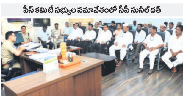
పీసీ కమిటీ సభ్యుల సమావేశంలో సీపీ సునీల్ దత్

మామిళ్లగూడెం, జూన్ 3: మత సామరస్యానికి ప్రతిబింబం పోయినా లని ఖమ్మం సీపీ సునీల్ దత్ సూచించారు. బుద్ధి పండుగ సందర్భంగా పోలీస్ కమిషనర్ కార్యాలయంలో పీసీ కమిటీ సభ్యులతో సోమవారం ఏర్పాటు చేసిన శాంతి సమావేశంలో ఆయన మాట్లాడారు. బుద్ధి పండుగను శాంతియుత వాతావరణంలో జరుపుకోవాలని సూచించారు. సరిహద్దు రాష్ట్రాల మీదుగా వచ్చే అక్రమ రవాణా కట్టడికి కమిషనరేట్ పరిధిలో 7 చెక్ పోస్టులు ఏర్పాటు చేసి నిరంతరం తనిఖీలు చేస్తున్నామని తెలిపారు. పశువుల అక్రమ రవాణా జరిగితే పోలీసులకు సమాచారం ఇవ్వాలని, శాంతిభద్రతలకు విఘనం కలిగిస్తే సహించే దేదీని హెచ్చరించారు. ప్రార్థనలకు ఎలాంటి సమస్యలు తలెత్తకుండా జాగ్రత్తలు తీసుకోవాలని మున్సిపల్ అధికారులకు సూచించారు. సమావేశంలో గంటల