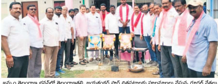
ఖమ్మం తెలంగాణ భవన్లో తెలంగాణతల్లి, జయశంకర్ సారీ దిత్రపటాలకు పూలమాలలు వేస్తున్న రూరల్ నేతలు

● దశాబ్దంలో రాష్ట్రాన్ని తీర్చిదిద్దిన ఘనత కేసీఆర్ ది ● రాష్ట్ర ఆవిర్భావ వేడుకల్లో బీఆర్ఎస్ నాయకులు ఖమ్మం / వైరా టౌన్ / ఖమ్మం రూరల్, జూన్ 2: కేసీఆర్ ఉద్యమం, అమరుల త్యాగాల ఫలమే నేటి తెలంగాణ అని బీఆర్ఎస్ నాయకులు పేర్కొన్నారు. ఉక్కు పిడికీటితో ఉద్యమించిన బిక్కుపడని కేసీఆర్.. తెలంగాణ సమాజాన్ని ఏకం చేసి స్వరాష్ట్రాన్ని సాధించారని గుర్తుచేశారు. తెలంగాణ ఏర్పాట్ల పదేళ్ల పూర్వం నందర్భంగా బీఆర్ఎస్ అధ్యక్షులలో సోమవారం నిర్వహించిన మూడో రోజు వేడుకల్లో పాల్గొనే నేతలు పార్టీ జెండా ఆవిష్కరణలు, ఆసు పత్రుల్లో రోగులకు పండ్లు పంపిణీలు, కేటీఆర్ కలిగివున్న వంటి కార్యక్రమాలు నిర్వహించారు. ఈ సందర్భంగా నేతలు మాట్లాడుతూ.. ప్రజా పోరాటంతో తెలంగాణను