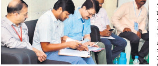
వివరాలు సమూహం చేసుకుంటున్న కలెక్టర్, ఎలక్ట్రన్ అబ్జర్వర్