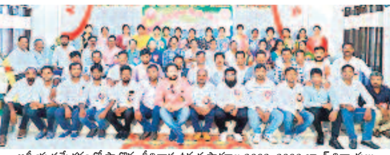
అత్యున్నత స్థాయిలో పాల్గొన్న శ్రీనివాస్ ఉన్నత పాఠశాల 2002-2008 బ్యాచ్ విద్యార్థులు