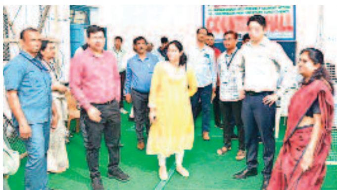
తెక్నికల్ హాల్ను పరిశీలిస్తున్న డీఈవో, ఎన్నికల పరిశీలకుడు, తెక్నికల్ పరిశీలకురాలు