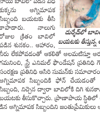
దుర్ఘటనలో బాలిలో పడిన శునకం బయటకు తీస్తున్న అగ్నిమాపక సిబ్బంది