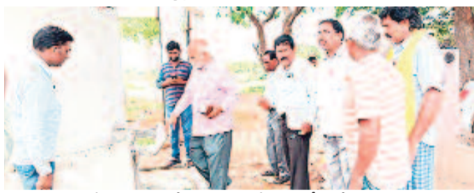
రాగంపేట పాఠశాలలో పనులను పరిశీలిస్తున్న డీఈవో జనార్ధన్ రావు

చొప్పదండి, జూన్ 3 : మండలంలోని అమ్మ ఆదర్శ పాఠశాలలో చేపట్టిన పనులన్నీ త్వరగా పూర్తి చేయాలని జిల్లా విద్యాధికారి జనార్ధన్ రావు ఆదేశించారు. సోమవారం మండలంలోని కొలిమికుంభ, పెద్దకర్నూరు, కాట్లపల్లి అమ్మ ఆదర్శ పాఠశాలలను సంద