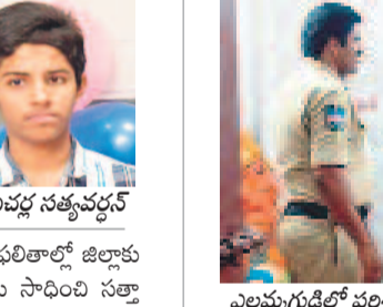
ఎల్లమ్మగుడిలో పరిశీలిస్తున్న కాన్స్టేబుల్, వివరాలు తెలుపుతున్న గీతకర్ణకులు

వీణవంక, జూన్ 3 : పోలీస్ డివిజన్ గ్రామంలోని ఎల్లమ్మగుడిలో అమ్మవారి వెండి ఆభరణాలు, హుండ్లని గుర్తు తెలియని వ్యక్తులు ఎత్తుకెళ్లారు. పోలీస్ డివిజన్ గీతకర్ణకులు తెలిపిన వివరాల ప్రకారం.. పోలీస్ డివిజన్ గ్రామంలో ఇటీవల సూతనంగా ఎల్లమ్మగుడి నిర్మించి, ప్రారంభోత్సవాన్ని చేసినట్లు తెలుసు. అదివారం రాత్రి గుర్తు తెలియని వ్యక్తులు గుడి తాళాలు పగలగొట్టి లోనికి చొరబెట్టారు. అమ్మవారి విగ్రహానికి అలంకరించిన వెండి ఆభరణాలు, హుండ్ల వోరీ చేశారు. సోమవారం గమనించిన గీతకర్ణకులు డయల్ 100కు ఫోన్ చేయగా, స్థానిక పోలీసులు గుడి వద్దకు చేరుకొని పరిశీలించారు. చోరికి గుర్తు తెలిపిన వెండి ఆభరణాల వివరాలు సుమారు రూ. 30 వేల వరకు ఉంటుందని గీతకర్ణకులు తెలిపారు.