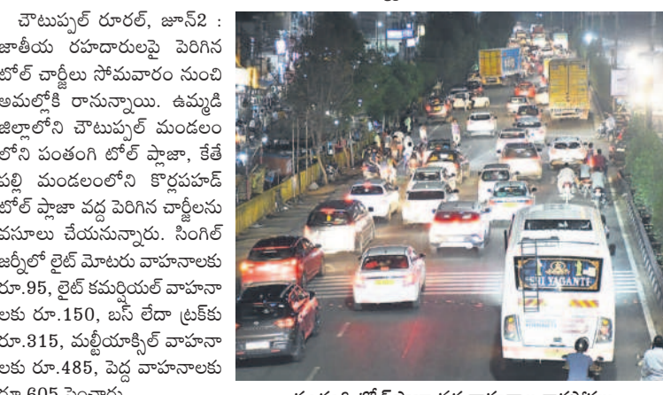
పంతంగి టోల్ ప్లాజా వద్ద వాహనాల రాకపోకలు

చౌటుప్పల్ రూరల్, జూన్ 2 : జాతీయ రహదారులపై పెరిగిన టోల్ చార్జీలు సోమవారం నుంచి అమల్లోకి రానున్నాయి. ఉమ్మడి జిల్లాలోని చౌటుప్పల్ మండలం లోని పంతంగి టోల్ ప్లాజా, కేట్ పల్లి మండలంలోని కొద్దపూడి టోల్ ప్లాజా వద్ద పెరిగిన చార్జీలను అమలు చేయనున్నారు. సింగిల్ జర్నీలో లైట్ మోటారు వాహనాలకు రూ.95, లైట్ కమర్షియల్ వాహనాలకు రూ.150, బస్ లోడింగ్ ట్రక్కు రూ.315, మల్టీయాక్సెల్ వాహనాలకు రూ.485, పెద్ద వాహనాలకు రూ.605 పెంచారు.