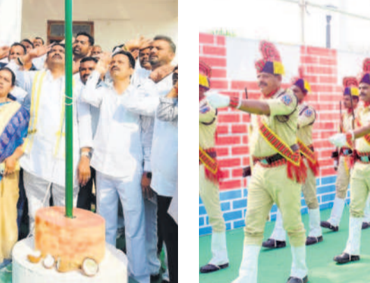
యాదాద్రి భువనగిరి కలెక్టరేట్లో పోలీసుల కవాతు