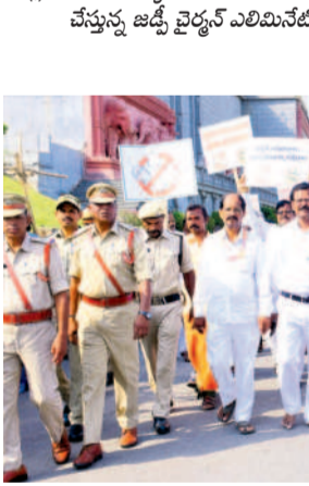
అవగాహన కార్యక్రమంలో పాల్గొన్న అలయ కమిటీ భాగస్వామి, అధికారులు