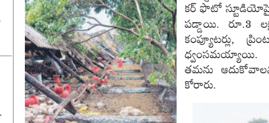
రామన్నపేట : బామప్పలలో గాలిదుమారానికి కూలిన కోళ్ళశావము