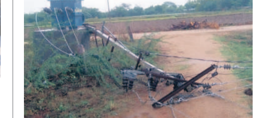
భువనగిరి మండలం వీరవెల్లిలో ఈదురుగాలులకు నెలకొరిగిన విద్యుత్ స్తంభం