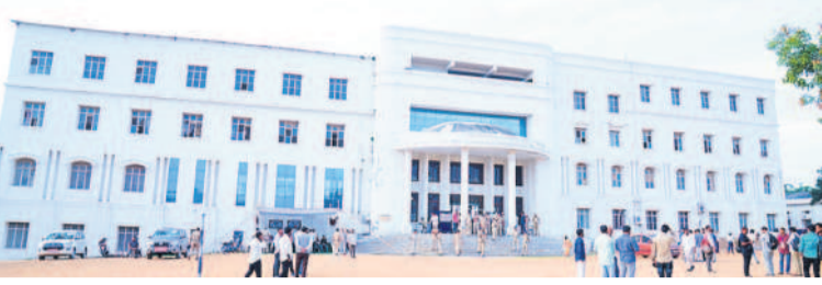
భువనగిరిలోని అర్రోరా ఇంజనీరింగ్ కళాశాల

అర్రోరా ఇంజనీరింగ్ కాలేజీలో కార్యక్రమం జరిగింది. టి.ఎం.ఎం.ఎస్. సీనియర్ కమిషనరీ కౌంటింగ్ కేంద్రం 800 మంది ఎన్నికల సిబ్బంది కౌంటింగ్ కేంద్రం వద్ద 144 సిక్స్