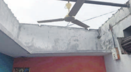
భువనగిరి మండలం బీవీఐ తిమ్మాపురంలో ఈదురుగాలులకు ఎగిరిపోయిన ఇంటి పైకప్పు

భువనగిరి కలెక్టరేట్, మే 2 : గాలి వాన బీభత్సం సృష్టించింది. ఒక్కసారిగా వీచిన ఈదురుగాలులతో మండలంలోని పలు గ్రామాల్లో విద్యుత్ స్తంభాలు నెలకొరిగాయి. ఇండ్లు, పశు