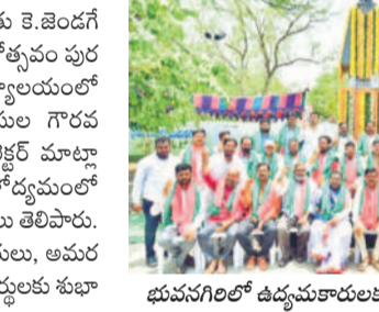
భువనగిరిలో ఉద్యమకారులకు సన్మాన కార్యక్రమం

ర్భావం తర్వాత ప్రజా సంక్షేమం, అభివృద్ధి ధ్యేయంగా పాలన సాగుతున్నదని గుర్తు చేశారు. ఈ క్రమంలో మనమందరం అంకితభావంతో పని చేసి అమరుల త్యాగాలకు గుర్తింపు నిర్ణామని చెప్పారు. ఇటీవల జరిగిన లోక్సభ ఎన్నికల్లో ప్రజలు అత్యధిక సంఖ్యలో ఓటు హక్కు వినియోగించుకొని పోలింగ్ శాతంలో రాష్ట్రంలోనే భువనగిరిని మొదటి స్థానంలో నిలిపారని, ఈ సందర్భంగా ప్రజలందరికీ ధన్యవాదాలు తెలిపారు. భువనగిరి పార్లమెంట్ నియోజకవర్గ ఎన్నికలు సజావుగా నిర్వహించడానికి కృషి చేసిన అధికారులు, సిబ్బందికి, పోలీసు యంత్రాంగానికి ప్రత్యేక కృతజ్ఞతలు చెప్పారు. జిల్లాలో పరిపాలనను ప్రజలకు చేరువగా తీసుకెళ్లి అభివృద్ధి ఫలాలను ప్రజలందరికీ అందేటట్లు చేయడానికి సహకారస్తున్న ప్రజాప్రతినిధులు, అధికారులు, పాత్రికేయులు, స్వచ్ఛంద సంస్థలు, బ్యాంకర్లకు కృతజ్ఞతలు తెలిపారు. కాంతి భద్రతలు కాపాడటంలో కృషి చేస్తున్న జిల్లా పోలీసు యంత్రాంగాన్ని అభినందించారు. అంతకు ముందు భువనగిరి పట్టణంలో అమరవీరుల