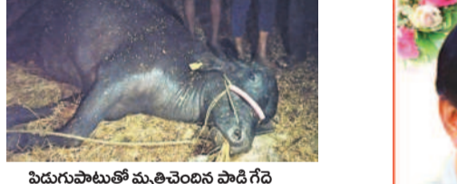
పెడుగుపాటుతో మృతిచెందిన పాడి గేదె