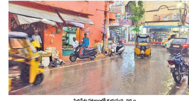
సిద్దిపేట పట్టణంలో కురుస్తున్న వర్షం

ఉరుములు మెరుపులతో కూడిన వర్షం సిద్దిపేట, జూన్ 2 : సిద్దిపేట పట్టణంలో పాటు ఆయా మండలాల్లో ఆదివారం సాయంత్రం ఉరుములు, మెరుపులతో కూడిన వర్షం కురిసింది. రోజంతా ఎండగా ఉండే సాయంత్రం వాన పడడంతో సాధారణం ఒక్కసారిగా చల్లబడింది. సిద్దిపేటలో కురిసిన వర్షానికి రోడ్లపై వర్షం నీళ్లు పారాయి.