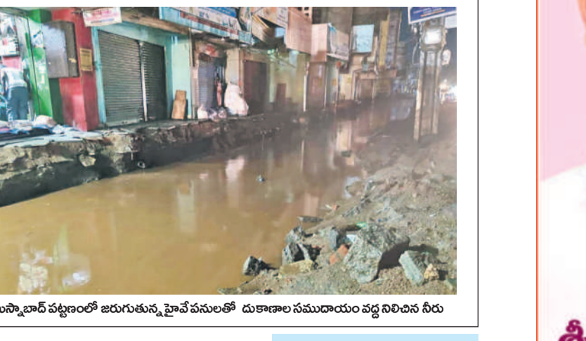
హుస్సాబాద్ పట్టణంలో జరుగుతున్న వైసీపీ పనులతో దుకాణాల సముదాయం వద్ద నిలిచిన నీరు

ఉరుములు మెరుపులతో కూడిన వర్షం సిద్దిపేట, జూన్ 2 : సిద్దిపేట పట్టణంలో పాటు ఆయా మండలాల్లో ఆదివారం సాయంత్రం ఉరుములు, మెరుపులతో కూడిన వర్షం కురిసింది. రోజంతా ఎండగా ఉండే సాయంత్రం వాన పడడంతో సాధారణం ఒక్కసారిగా చల్లబడింది. సిద్దిపేటలో కురిసిన వర్షానికి రోడ్లపై వర్షం నీళ్లు పారాయి.