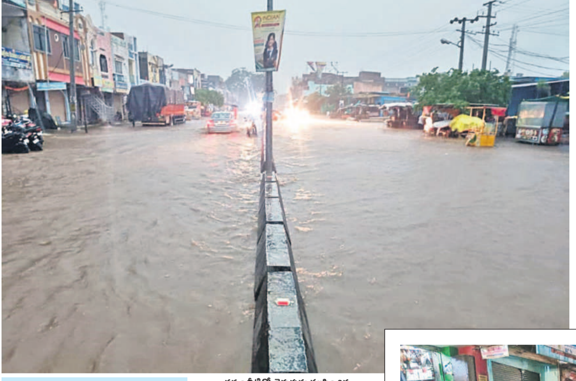
వర్షం నీటితో చెరువును తలచిందిన హుస్సాబాద్ పట్టణంలోని మొయిన రోడ్డు