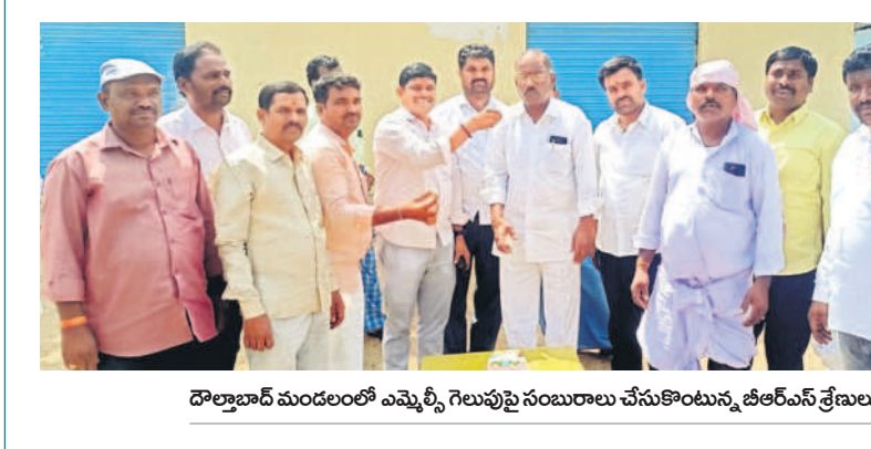
దొర్లబాద్ మండలంలో ఎమ్మెల్యే గెలుపును సంబురాలు చేసుకొంటున్న బీఆర్ఎస్ శ్రేణులు