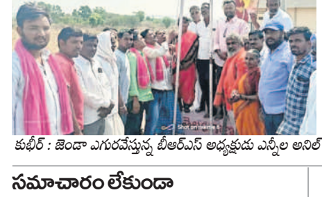
కుటీర్ : జెండా ఎగురవేస్తున్న బీఆర్ఎస్ అధ్యక్షుడు ఎన్.పి. అనిల్