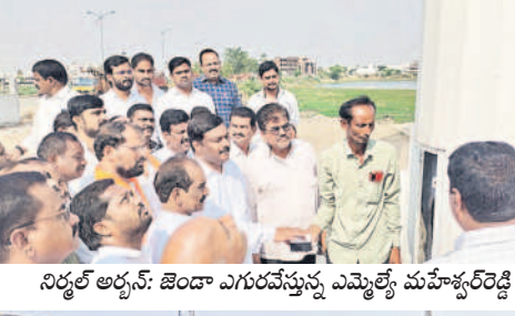
నిర్మల్ అర్చన: జెండా ఎగురవేస్తున్న ఎమ్మెల్యే మహేశ్వర్ రెడ్డి