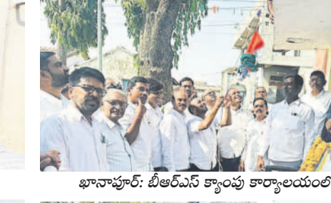
ఖానాపూర్: బీఆర్ఎస్ క్యాంపు కార్యాలయంలో ..