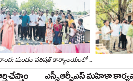
అక్షణవాండ్: మండల పరిషత్ కార్యాలయంలో ..