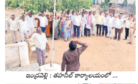
ఇంద్రవెల్లి : తహసీల్ కార్యాలయంలో ..