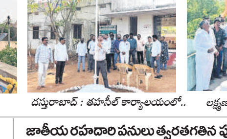
దస్తూరాబాద్ : తహసీల్ కార్యాలయంలో..