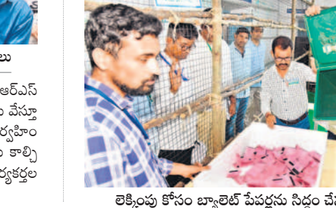
లెక్కింపు కోసం బ్యాలెట్ పేపర్లను సిద్ధం చేస్తున్న సిబ్బంది