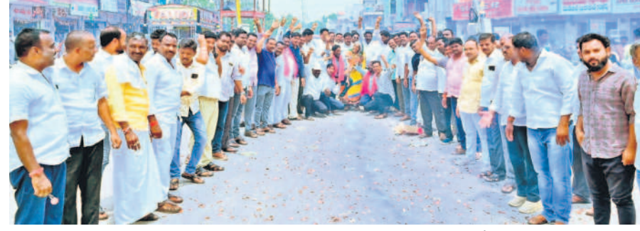
జోగుశాంబ గద్వాల జిల్లా కేంద్రంలో సంబురాలు చేసుకుంటున్న బీఆర్ఎస్ శ్రేణులు