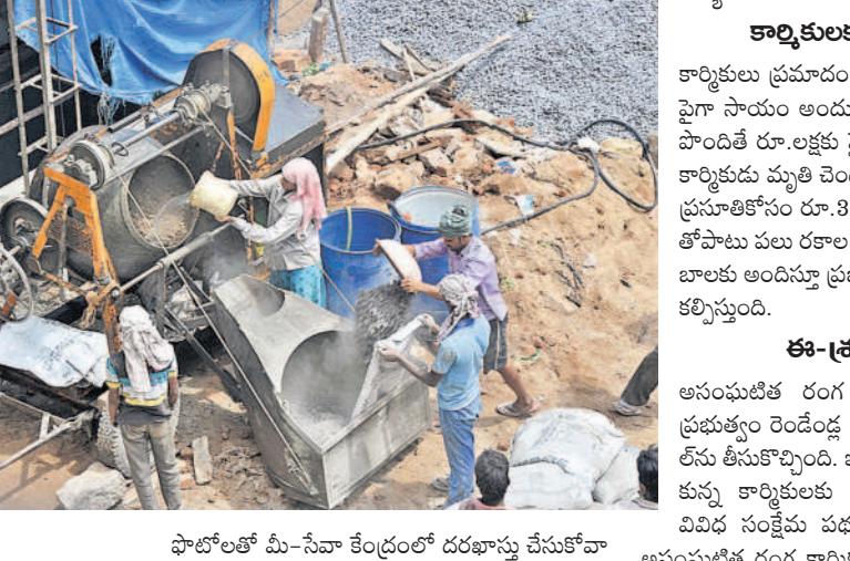
భారత్ లో మి-సేవా కేంద్రంలో దరఖాస్తు చేసుకోవాలి. అనంతరం మి-సేవలో ఇచ్చిన రసీదు, కార్మికుల సంఘం గర్భింపు కార్డుతో కార్మికులకు కార్యాలయంలో అందజేయాలి. అక్కడి అధికారులు పత్రాలను క్షణంగా పరిశీలించి తెలంగాణ కార్మికులకు శాఖ లెటర్ కార్డును మీ

మొయినాబాద్, జూన్ 1 : భవనాన్ని నిర్మించాలంటే సుమారుగా పదిరంగాల కార్మికులు పని చేస్తుంటారు. ఇల్లు, భవనాల నిర్మాణం జరిగినప్పుడు ప్రమాదాల బారిన పడి కార్మికులు మృతి చెందడం, గాయపడడం వంటివి జరుగుతుంటాయి. అలాంటి సమయంలో కార్మికులకు భరోసా ఇస్తూ కేంద్ర, రాష్ట్ర ప్రభుత్వాల పలు పథకాలను ప్రవేశపెట్టే చేయాల్సి ఉన్నాయి. ప్రమాద బీమా కల్పిస్తూ కార్మికులకు భీమా అందిస్తున్నాయి. ఉమ్మడి రాష్ట్రంలో 2009లో కార్మికులను ఆదుకునేందుకు ఉత్తర్యులు జారీ చేయడంతోపాటు తెలంగాణ భవన నిర్మాణ కార్మికుల సంక్షేమ మండలిని ఏర్పాటు చేశారు.