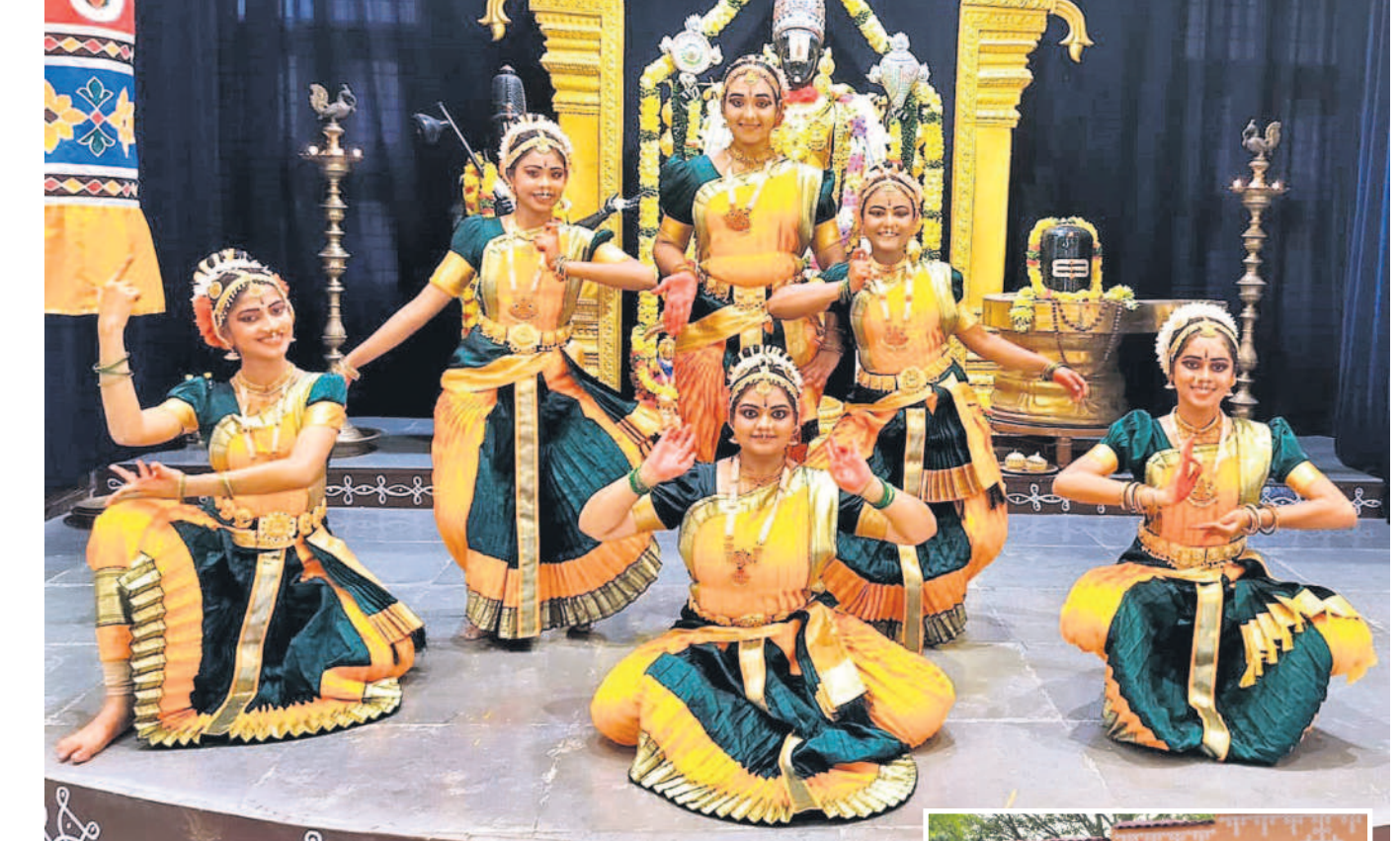
నృత్య ప్రదర్శనలతో అలరిస్తున్న కళాకారులు