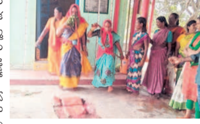
కట్ట మైసమ్మ తల్లి ఆలయం వద్ద వడ్డలు, భక్తులు