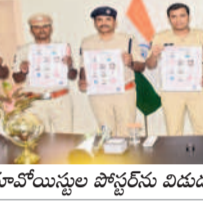
మావోయిస్టుల పోస్టర్స్ విడుదల చేస్తున్న ఎస్.పీ.కిరణ్ ఖర్

మావోయిస్టుల పోస్టర్స్ విడుదల చేసిన ఎస్.పీ.కిరణ్ ఖర్