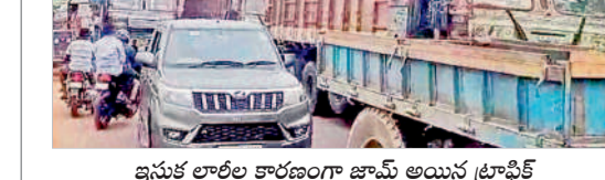
ఇసుక లారీల కారణంగా జామ్ అయిన ట్రాఫిక్