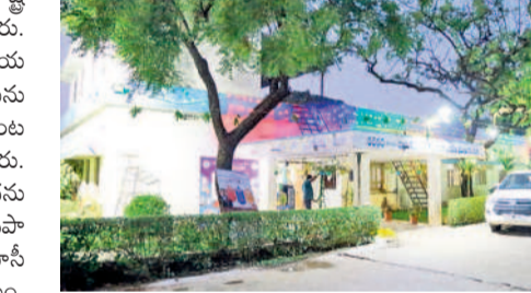
విద్యుత్ కాంతుల్లో ములుగు కలెక్టరేట్

ములుగు రూరల్/గణపూరం, జూన్ 1: తెలంగాణ రాష్ట్ర అవతరణ వేడుకలకు అధికారులు ఏర్పాటు పూర్తి చేశారు. ఆదివారం అన్నీ ప్రభుత్వ కార్యాలయాల ఎదుట జాతీయ జెండాను ఆలూ కులు అధికారులు ఎగవేయకుండా నున్నారు. ములుగు కలెక్టరేట్లో వేడుకలకు ఉదయం 9 గంటల కలెక్టర్ ఇలా శ్రీవారి జెండాను ఆవిష్కరించారు. అనంతరం జిల్లా ప్రగతి నివేదికను చదివి వినిపించుకున్నారు. శనివారం రాత్రి కలెక్టరేట్ భవనాన్ని విద్యుత్ డిమాండ్ తో ఆంకురించారు. గణపూరం మండలంలోని తహసీల్దార్ కార్యాలయం, మండల పరిషత్ కార్యాలయం, పోలీస్ స్టేషన్, ఇతర కార్యాలయాలను ముస్తాబు చేశారు.