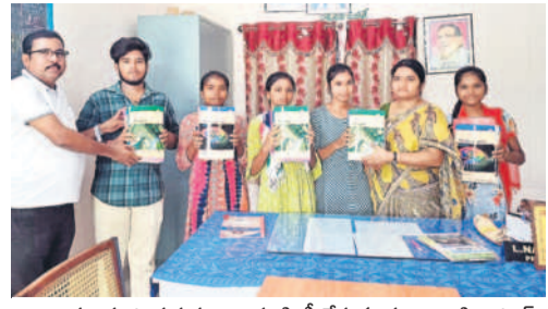
విద్యార్థులకు పాఠ్యపుస్తకాల పంపిణీ చేస్తున్న కళాశాల సైనికారి