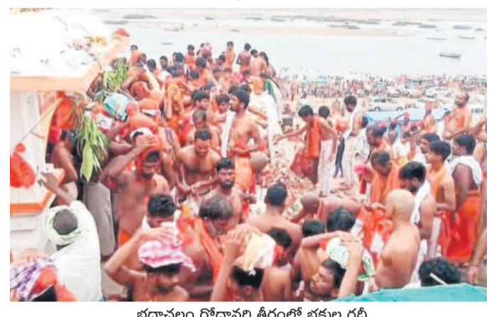
భద్రాచలం గోదావరి తీరంలో భక్తుల రద్దీ