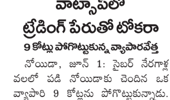
వాట్సాప్లో ట్రిడింగ్ పేరుతో టోకరా