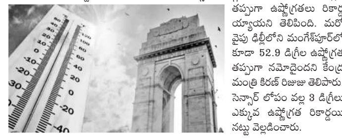
తప్పుగా ఉష్ణోగ్రతలు రికార్డులను సృష్టించిన ఢిల్లీలోని మంగేశ్వర్ లో కూడా 52.9 డిగ్రీల ఉష్ణోగ్రత తప్పుగా నమోదైన కేంద్ర మంత్రి కిరణ్ రిజిస్ట్రార్ జి.ఎ.ఎ. సెన్సార్ లోపం వల్ల 3 డిగ్రీలు ఎక్కువ ఉష్ణోగ్రత రికార్డులు నట్లు వెల్లడించారు.