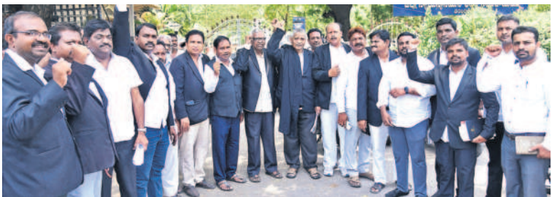
వరంగల్ కోట్ల పద్మల నిరసనలో పాల్గొన్న న్యాయవాదులు