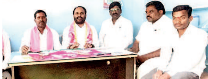
సమావేశంలో పాల్గొన్న బీఆర్ఎస్ నాయకులు

ఇటలీయన్లు, మే 30 : రాష్ట్ర ఆవతరణ దినోత్సవం సందర్భంగా బీఆర్ఎస్ అధ్యక్షులలో దశాబ్ది ఉత్సవాలు పునంగా నిర్వహించనున్నట్లు ఆ పార్టీ జిల్లా నాయకులు కర్నూలు, మండల అధ్యక్షులు మిల్కల కర్నూలు, మండల అధ్యక్షులు మిల్కల కర్నూలు అన్నారు. గురువారం ఇటలీయన్లను సత్కరించే ఉత్సవం ఏర్పాటు చేసిన విలేజ్ లో, సమావేశంలో వారు మాట్లాడుతూ.. ఎన్సీ