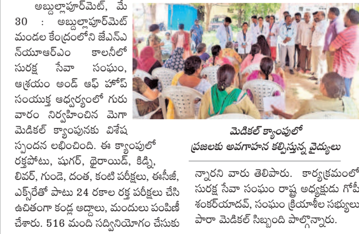
మెడికల్ క్యాంపులో ప్రజలకు అవగాహన కల్పిస్తున్న వైద్యులు