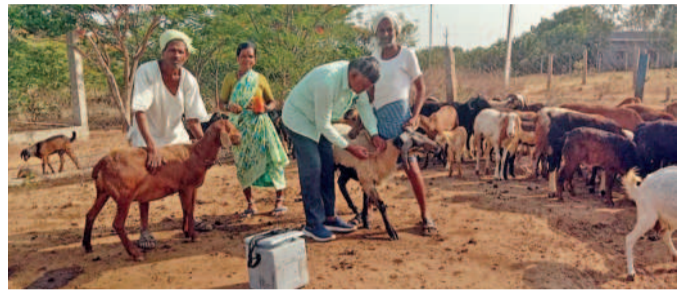
కుమ్మరిగూడలో టీకాలకు చిరునామా వేస్తున్న వైద్య సిబ్బంది