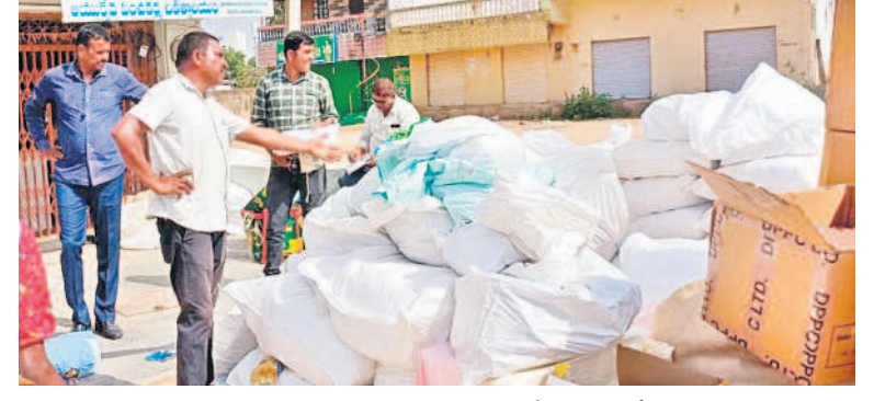
స్వాధీనం చేసుకున్న గుట్టా ప్యాకెట్లను పరిశీలిస్తున్న పోలీసులు