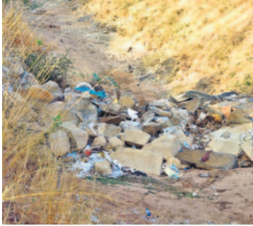
నాగర్ కర్నూల్ జిల్లా కేంద్రం సమీపంలోని సరస్వతి అలయం వద్ద కాల్కులో ఉన్న రాళ్లు

మహబూబ్ నగర్, మే 30 (సమస్య తెలంగాణ ప్రతినిధి) : వానకాలం ప్రారంభమవుతున్న సాక్షాత్తు సీఎం సొంత జిల్లాలోనే ప్రాజెక్టుల మొయింటినెస్స్ ను సరిదిద్దడం అధికారులు పట్టించుకోవడం లేదు. రాష్ట్రంలో కాంగ్రెస్ ప్రభుత్వం అధికారంలోకి వచ్చి ఆరు నెలలవుతున్నా.. ఉమ్మడి మహబూబ్ నగర్ జిల్లాలోని ప్రాజెక్టులకు మరమ్మతులు చేయడంలో అధికారుల అలసత్వం స్పష్టంగా కనిపిస్తున్నది. రాష్ట్రంలో కొత్త సర్కారు కొలువు