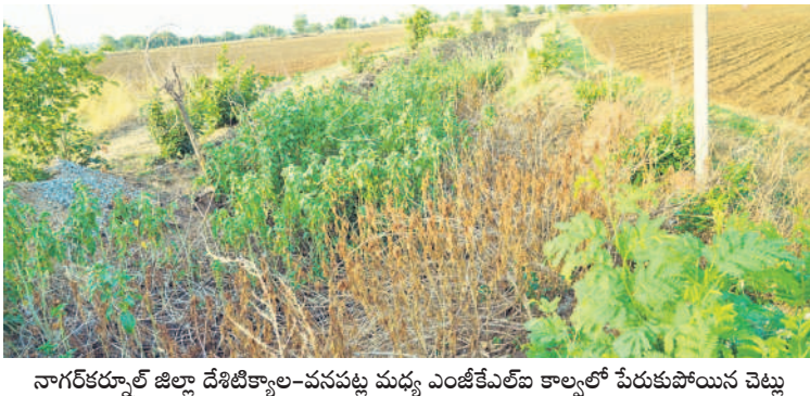
నాగర్ కర్నూల్ జిల్లా దేశికికాల్-వనపట్ల మధ్య ఎంజీకేఎల్ కాల్కులో పెరుగుతున్న చెట్లు

మహబూబ్ నగర్, మే 30 (సమస్య తెలంగాణ ప్రతినిధి) : వానకాలం ప్రారంభమవుతున్న సాక్షాత్తు సీఎం సొంత జిల్లాలోనే ప్రాజెక్టుల మొయింటినెస్స్ ను సరిదిద్దడం అధికారులు పట్టించుకోవడం లేదు. రాష్ట్రంలో కాంగ్రెస్ ప్రభుత్వం అధికారంలోకి వచ్చి ఆరు నెలలవుతున్నా.. ఉమ్మడి మహబూబ్ నగర్ జిల్లాలోని ప్రాజెక్టులకు మరమ్మతులు చేయడంలో అధికారుల అలసత్వం స్పష్టంగా కనిపిస్తున్నది. రాష్ట్రంలో కొత్త సర్కారు కొలువు