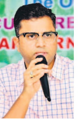
మాట్లాడుతున్న ఉదయకుమార్ గి ధ్రువీకరణ

నాగర్ కర్నూల్, మే 30 : జిల్లాలో వానకాలం సాగు ప్రారంభం కానున్న నేపథ్యంలో నకిలీ విత్తన వ్యాపారాలపై అధికారులు పటిష్ట నిఘా పెట్టాలని వ్యవసాయ, పోలీస్ అధికారులతో కూడిన టాన్సిఫోర్స్ బృందాలను కలెక్టర్ ఉదయకుమార్ ఆదేశించారు. గురువారం కలెక్టర్ ఆఫీసులో ఉదయకుమార్ ఆధ్వర్యంలో వ్యవసాయ, పోలీస్ శాఖలతో ఏర్పాటు చేసిన టాన్సిఫోర్స్ బృందాల అధికారులతో నకిలీ విత్తనాలు, ఎరువులపై తీసుకోవాల్సిన చర్యలపై సమన్వయ సమావేశం నిర్వహించారు. ఈ సందర్భంగా కలెక్టర్ మాట్లాడుతూ జిల్లాలో వానకాలంలో 4,59 లక్షల ఎకరాల్లో వివిధ పంటలు సాగు చేస్తారని, అందులో 2,78,720 ఎకరాల్లో పత్తి, 1,40,082 ఎకరాల్లో వరి, 45,237 ఎకరాల్లో మొక్కజొన్న పంటలు సాగు చేస్తారన్నారు. జిల్లావ్యాప్తంగా 668 విత్తన విక్రయ కేంద్రాలున్నాయని.. నకిలీ విత్తనాలు, ఎరువుల విక్రయాలను అరికట్టడానికి మండలాలలో ప్రత్యేక టాన్సిఫోర్స్ బృందాన్ని ఏర్పాటు చేశామన్నారు. పోలీస్, వ్యవసాయశాఖ సంయుక్త ఆధ్వర్యంలో టాన్సిఫోర్స్ సభ్యులు జిల్లాలోని ఆయా ప్రాంతాల్లో సోదాలు చేయాలని, నాసిరకం విత్తనాలు అమ్మేవారిపై వీడియో నమోదు చేయాలని ఆదేశించారు. వ్యాపారులు నకిలీ, నాసిరకం విత్తనాలను రైతులకు అమ్మగట్టే ప్రయత్నం చేస్తారని, వారిపై ప్రత్యేక దృష్టి పెట్టాలన్నారు. అనుమతి లేని, బీటీ-3, నకిలీ విత్తనాలను వ్యాపారులు మార్కెటింగ్ చేయడానికి ప్రయత్నిస్తుంటారని. వారి వల్ల గురిదిది తగ్గి రైతులు తీవ్రంగా నష్టపోయే ప్రమాదం ఉంటుందన్నారు. దీనిని అరికట్టేందుకు