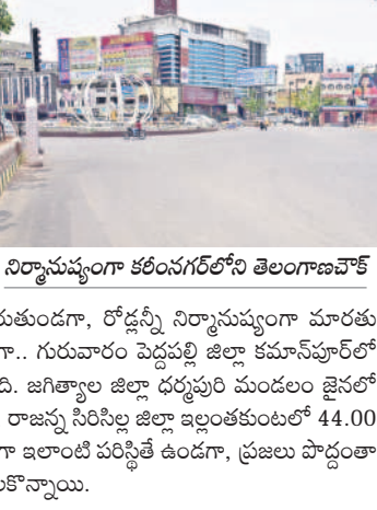
నిర్మానుష్యంగా కరీంనగర్లోని తెలంగాణచౌక్

జగిత్యాల టౌన్/ ధర్మారం, మే 30: మళ్ళీ భానుడు భగభగమంటున్నాడు. రోహిణి కార్పెల్ రోకండ్ల పగిలేలా దందికొడుతున్నాడు. ఉదయం 9 గంటల నుంచే ప్రతాపం చూపుతున్నాడు. 11గంటల నుంచే మాడు పగుల కొడుతున్నాడు. మధ్యాహ్నం కల్లా నిప్పుల కొలిమిలా మారుతుండగా, రోడ్లన్నీ నిర్మానుష్యంగా మారుతున్నాయి. సాయంత్రం దాకా భగభగమంటుండగా.. గురువారం పెద్దపల్లి జిల్లా కమాన్వెల్త్ లో గరిష్ట ఉష్ణోగ్రత 46.7 డిగ్రీలు నమోదయ్యింది. జగిత్యాల జిల్లా ధర్మారం మండలం జైన్లో 45.8, కరీంనగర్ జిల్లా జమ్మికుంటలో 45.4, రాజన్న సిరిసిల్ల జిల్లా ఇల్లంతకుంటలో 44.00 డిగ్రీలు రికార్డయ్యాయి. ఉమ్మడి జిల్లావ్యాప్తంగా ఇలాంటి పరిస్థితి ఉండగా, ప్రజలు పొద్దుతా ఇండ్ల నుంచి బయటికి రావేని పరిస్థితులు నెలకొన్నాయి.