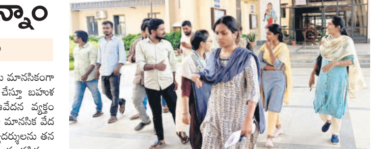
మంధని ఎంపీవోపై ఫిర్యాదు చేసేందుకు కలెక్టరేట్ కు వస్తున్న పంచాయతీ కార్యదర్శులు