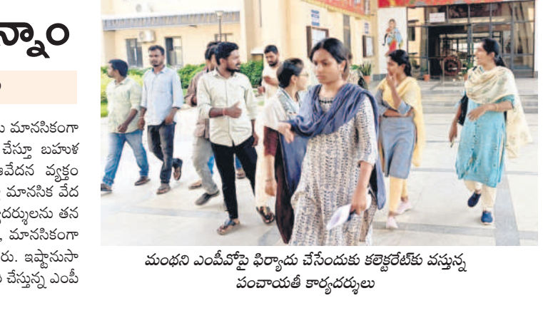
మంధని ఎంపీవోపై ఫిర్యాదు చేసేందుకు కలెక్టరేట్ కు వస్తున్న పంచాయతీ కార్యదర్శులు

మంధని ఎంపీవోపై అదనపు కలెక్టర్ కు పంచాయతీ కార్యదర్శుల ఫిర్యాదు పెద్దపల్లి, మే 30 : మంధని ఎంపీవో ఆర్ డి హుస్సేన్ వేధింపులు భరించలేకపోతున్నామని గ్రామ పంచాయతీ కార్యదర్శులు గురువారం స్థానిక సంస్థల అదనపు కలెక్టర్ జే ఆరుణశ్రీ, డీపీవో ఆశాలతకు కలెక్టరేట్ లో ఫిర్యాదు చేశారు. ఎంపీవో తమను అసభ్యకర పదజాలంతో దూషిస్తున్నారని, ఆయనపై చర్యలు తీసుకోవాలని అదనపు కలెక్టర్ ను కోరారు. అనంతరం వారు మాట్లాడారు. మండలంలోని 34 గ్రామ పంచాయతీలకు కార్యదర్శులుగా విరులు నిర్వహిస్తున్నామని, ఎంపీవో గతేడాది కాలం నుంచి పంచాయతీ కార్యదర్శులు, ముఖ్యంగా మహిళా కార్యదర్శులను మానసికంగా వేధిస్తున్నారని తెలిపారు. వికృత చేస్తున్న చేస్తూ బహుళ అర్థాలు వచ్చేలా మాట్లాడుతున్నారని ఆవేదన వ్యక్తం చేశారు. అర్ధరాత్రి అయ్యేదాకా ఫోన్లు చేస్తూ మానసిక వేదనకు గురి చేస్తున్నారని వాపోయారు. కార్యదర్శులకు వేదన వ్యక్తిగత ద్వేషంగా వాడుకుంటూ అధికంగా, మానసికంగా తీవ్ర మనోవేదన గురి చేస్తున్నారని తెలిపారు. ఇప్పానుసారంగా ప్రవర్తిస్తూ తమను ఇబ్బందులకు గురి చేస్తున్న ఎంపీవోపై చర్యలు తీసుకోవాలని కోరారు.