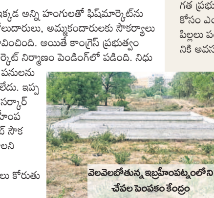
నెలవెలవేతున్న ఇబ్రహీంపట్నంలోని చేప పెంపకం కేంద్రం

రోడ్లపైనే అమ్మకాలు.. మార్కెట్ సౌకర్యం లేకపోవడంతో మత్స్యకారులు తీవ్ర ఇబ్బందులకు గురవుతున్నారు. ఇబ్రహీంపట్నంలో పాటు తుర్కయ్యాంజాల్, రాగన్నగూడ, బొంగూర్, యారాం, మాల్, తదితర ప్రాంతాల్లో రోడ్లపైనే చేపలను విక్రయించాల్సిన దుస్థితి నెలకొన్నది. దీంతో ఇటు వ్యాపారులు, అటు వాహనదారులు, పాదచారులు తీవ్ర అవస్థలు పడుతున్నారు. గత ప్రభుత్వం జిల్లావ్యాప్తంగా పెద్ద ఎత్తున చెరువుల్లో చేపపిల్లల పెంపకానికి శ్రీకారం చుట్టింది. నాలుగు కోట్ల ఖర్చులకు చేపపిల్లలను మత్స్యశాఖ అధ్యర్థంలో ఆయా సాఫ్ట్వేర్ల పరిధిలోని చెరువుల్లో పెంపకానికి కేటాయించారు. చెవిన చేపలను విక్రయించేందుకు ఒక మార్కెట్ ఉండాలనే ఉద్దేశంతో ఇక్కడ అన్ని హంగులతో ఫిష్ మార్కెట్ను నిర్మించాలని భావించింది. అయితే కాంగ్రెస్ ప్రభుత్వం రాకతో ఫిష్ మార్కెట్ నిర్మాణం పెండింగ్లో పడింది. నిధులున్నా ఇప్పటికీ పనులను ప్రారంభించడంలేదు. ఇప్పటికే ఫిష్ మార్కెట్ నిర్మాణం పెండింగ్లో ఉన్నందున ఇబ్రహీంపట్నంలో మార్కెట్ సౌకర్యాన్ని కల్పించాలని మత్స్యకారులు, కొనుగోలుదారులు కోరుతున్నారు.