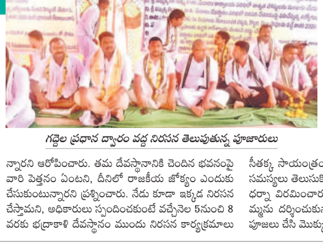
గద్దెల ప్రధాన ద్వారం వద్ద నిరసన తెలుపుతున్న పూజారులు