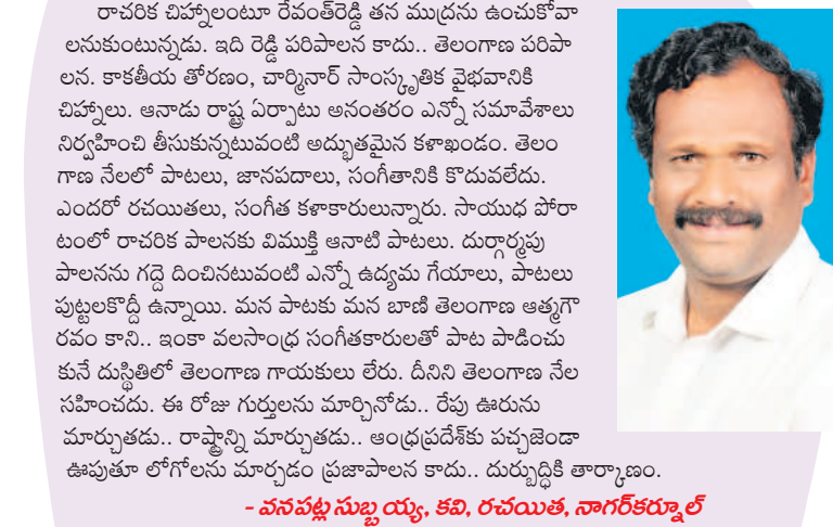
వనపర్తి ముఖ్య న్యాయ, కవి, రచయిత, నాగకర్నూల్

చార్మినార్, కాకతీయ తోరణాలు రాష్ట్రంలోనే కాకుండా జాతీయస్థాయిలో గుర్తింపు పొందిన చారిత్రక కట్టడాలు. గత పాలకులు కష్టపెట్టి, కార్మికులు, ఉద్యమకారుల కష్టసుఖాలను ప్రతిబింబించేలా లోగోను తయారు చేశారు. ఒక వ్యక్తినీ, ఒక ప్రాంతాన్ని తక్కువ చేసేలా లోగోను రూపొందించొద్దు. ప్రజాభిప్రాయం మేరకు ప్రభుత్వం నిర్ణయం తీసుకోవాలి. అంతే కానీ ఐడెంట్ కేసీఆర్ మారే పాలకుల సొంత నిర్ణయాలపై లోగోను మార్చడం సరైన పద్ధతి కాదు. తెలంగాణ సంస్కృతి, సంప్రదాయాలు, కళలను ప్రతిబింబిస్తూ.. రాష్ట్ర ఖ్యాతినీ పెంచే విధంగా, రాజకీయాలకతీతంగా లోగో మార్పుపై నిర్ణయం తీసుకుంటే బాగుంటుంది. - సంస్కృతి అశక్తి, ప్రజా నాట్యమండలి జిల్లా కార్యదర్శి, లలంపూర్