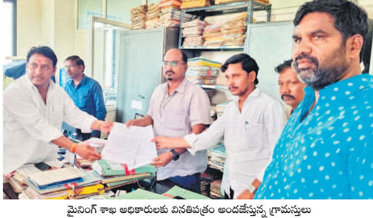
మైనింగ్ శాఖ అధికారులకు వినవినత్రం అందజేస్తున్న గ్రామస్థులు