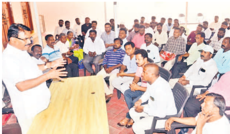
సమావేశంలో మాట్లాడుతున్న మాజీ మంత్రి సింగిరెడ్డి నిరంజన్రెడ్డి