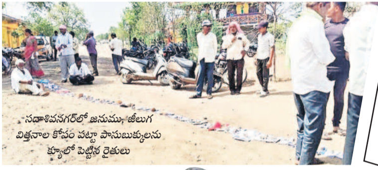
సదాశివపేటలో జనుము, జీలుగ విత్తనాల కోసం పట్టా పాసులు కలుగుతున్న క్యూలో పెట్టిన రైతులు

మాత్రమే రావడంతో కొందరికే లభించాయి. ఉదయం 6 గంటలకు వచ్చినా విత్తనాలు దొరకలే దని పలువురు రైతులు నిరాశగా వెనుదిరిగారు. మండల వ్యవసాయాధికారి ప్రజాప్రతిని వివరణ కోరగా రైతులకు అసైన్ చేసిన విత్తనాలు అందజేస్తున్నామని, మరిన్ని బస్సుల కోసం ప్రభుత్వానికి బుడవారం పంపిణీ కేంద్రాలకు చేరుకున్నాయి. తీరా చూస్తే జీలుగ 987, జనుము 800 బస్సులు